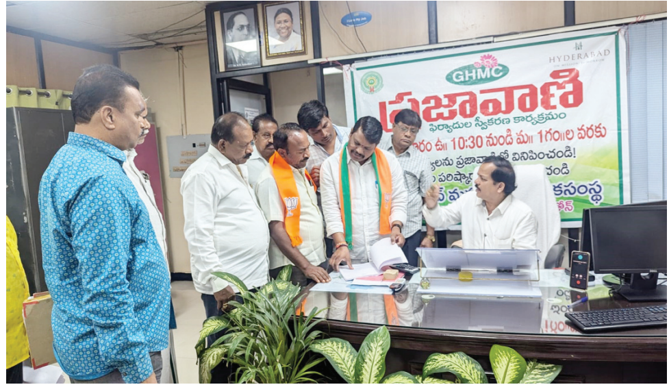
కుత్బుల్లాపూర్ సర్కిల్-25 ప్రజావాణిలో బీజేపీ ఫిర్యాదు..