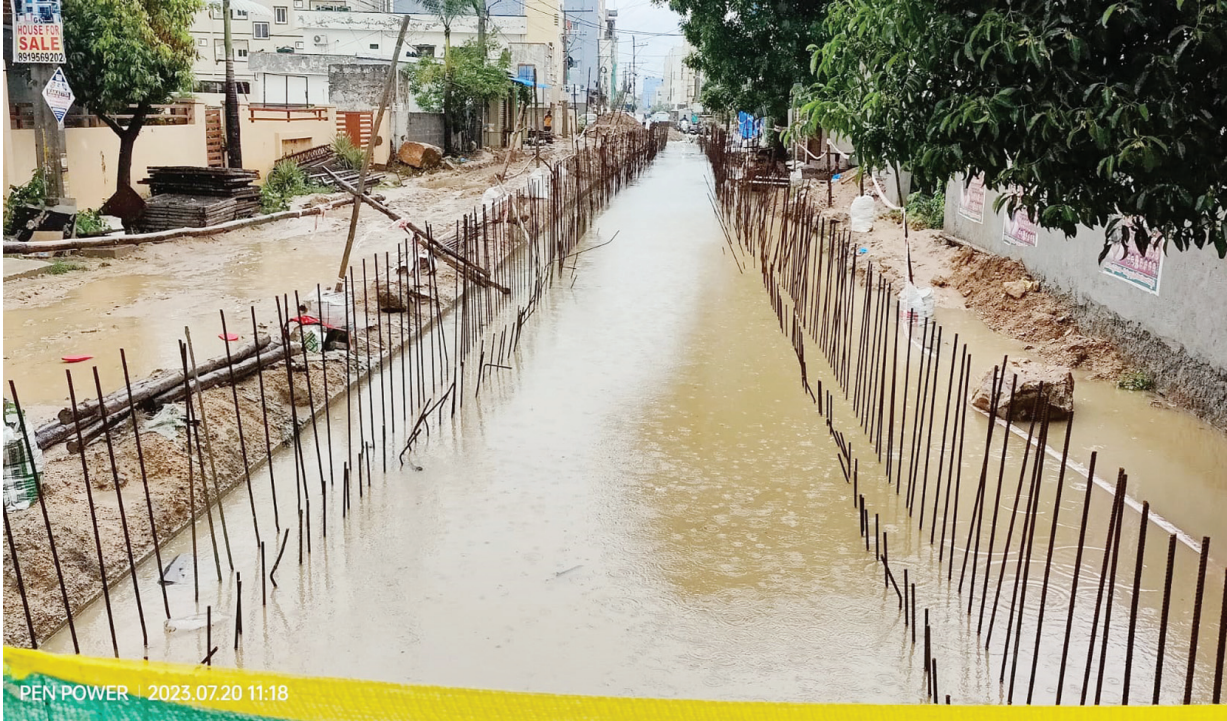
PEN POWER | 2023.07.20 11:18