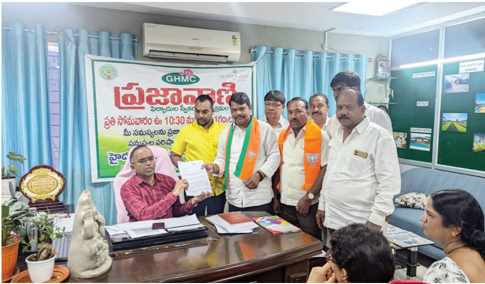
గాజులరామారం సర్కిల్-26 ప్రజావాణిలో డిప్యూటీ కమిషనర్ కు ఫిర్యాదు..