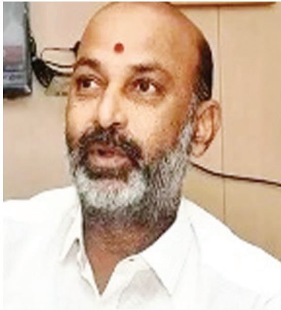
అసెంబ్లీ ఎన్నికల సందర్భంగా రాహుల్ గాంధీ నిరుద్యోగులకు ఇచ్చిన 'మొహబ్బత్

కీ దుకాన్' ఇదేనా అంటూ నిలదీశారు. వెంటనే నిరుద్యోగులతో సామరస్యపూర్వకంగా చర్చించి, వారి ఆందోళనను విరమింప చేయాలని రేవంత్ రెడ్డి సర్కారును డిమాండ్ చేశారు. గ్రూప్ 2 పరీక్ష వాయిదా వేయాలని కోరుతూ నిరుద్యోగులు శనివారం రాత్రి చిక్కడ పల్లి నుంచి అశోక్ నగర్ చౌరస్తా వరకు భారీ ర్యాలీ నిర్వహించారు. ఆపై ఆర్టీసీ క్రాస్ రోడ్ వద్ద ఖైదయ్యారు. ఈ ధర్మాకు సంబంధించిన షాట్‌లో, వీడియోలను బండి సంజయ్ తన ట్విట్టర్ ఖాతాలో పోస్ట్ చేశారు. 'ఇదే అశోక్ నగర్