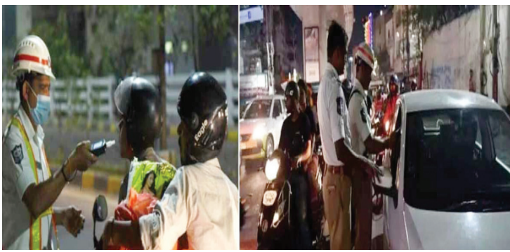
ఎక్కువ టైకర్ల ఉన్నారు. టూవీలర్ నడుపుతూ డ్రంక్ అండ్ డ్రైవ్ చెకింగ్ లో మొత్తం 1346 మంది దొరికారు. వీరందరికీ గోషామహల్, బేగంపేట టీటీల వద్ద కొన్సెలింగ్ కూడా ఇచ్చారు ట్రాఫిక్ పోలీసులు. మళ్లొక్క సారి పట్టుబడితే డ్రైవింగ్ లైసెన్సులు శాశ్వతంగా రద్దు చేస్తామని హెచ్చరించారు.

హైదరాబాద్ పెన్ పవర్: హైదరాబాద్ ట్రాఫిక్ పోలీసులు షాకింగ్ న్యూస్ చెప్పారు. రోజురోజుకు తాగి బండ్లు నడిపే వారి సంఖ్య పెరుగుతోందని అంటున్నారు. కేవలం పదిరోజులు నిర్వహించిన చివరి డ్రంక్ అండ్ డ్రైవ్ తనిఖీల్లో ఏకంగా 16 వందల మందిపై కేసులు నమోదు చేసినట్లు వెల్లడించారు. జూలై 1నుంచి జూలై 10 వరకు హైదరాబాద్ నగర వ్యాప్తంగా నిర్వహించిన డ్రంక్ అండ్ డ్రైవ్ తనిఖీల్లో తాగి వాహనాలు నడుపుతున్న 1,614 మందిపై కేసులు నమోదు చేశారు. డ్రంక్ అండ్ డ్రైవ్ కేసుల్లో వివిధ కోర్టుల్లో మొత్తం 992 ఛార్జ్ షీట్లు దాఖలు చేశారంటే.. నగరంవాసులు ఎంతలా తాగి ఊగుతూ బండ్లు నడుపుతున్నారో అర్థమవుతోంది. అంతేకాదు.. వీరిలో 55 మందికి 15 రోజుల జైలు శిక్ష పడింది. 8మంది డ్రైవింగ్ లైసెన్సులు రద్దు చేశారు. మొత్తంగా తాగి బండ్లు నడిపిన మందుబాబుల నుంచి 21లక్షల 36వేల రూపాయల జరిమానాకూడా వసూలు చేశారు. డ్రంక్ అండ్ డ్రైవ్ తనిఖీల్లో పట్టుబడిన వారంతా