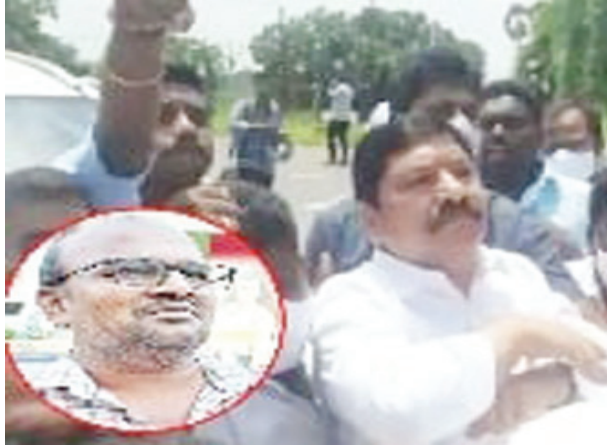
దాడి చేశారు. అప్పట్లో ఈ కేసు ముందుకు సాగలేదు సరికదా, బాధితులపైనే పోలీసులు కేసులు పెట్టారు.