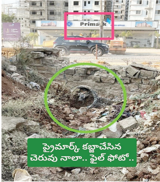
ప్రైమార్క్ కబ్జాచేసిన చెరువు నాలా.. ఫైల్ ఫోటో..