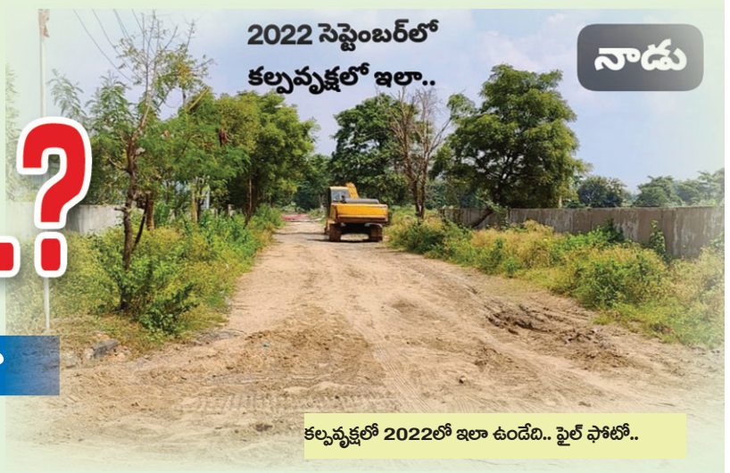
కల్వనూర్లో 2022లో ఇలా ఉండేది.. ఫైల్ ఫోటో..