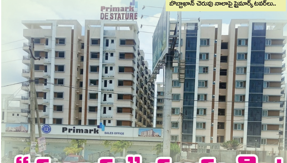
బొబ్బాఖాన్ చెరువు నాలాపై ప్రైమార్క్ టవర్లు..