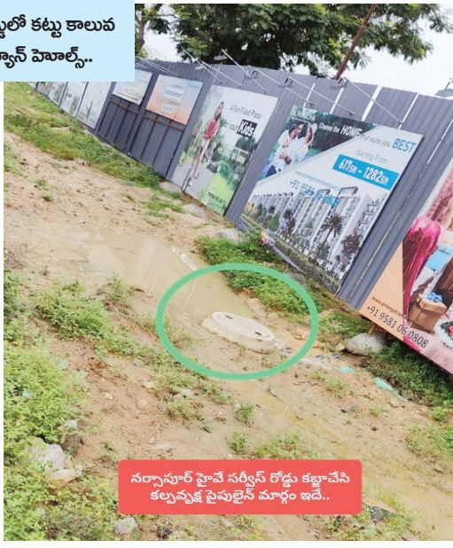
సర్వీస్ రోడ్డులో కట్టు కాలువ ప్రైవైజ్ మ్యాన్ హోల్స్..