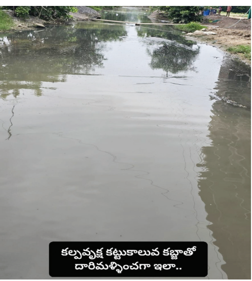
కల్వవృక్ష కట్టుకాలువ కబ్జాతో దారిమళ్ళించగా ఇలా..