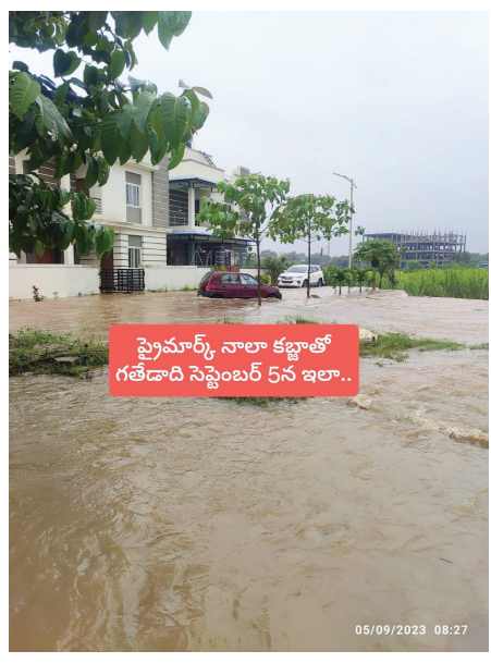
ప్రైమార్క్ నాలా కబ్జాతో గతేడాది సెప్టెంబర్ 5న ఇలా..

మేధ్యల్ జిల్లా దుండిగల్ మున్సిపల్ బహుదూర్పల్లిలోని శ్రీరామ్ అయోధ్య విల్లాల వాసులకు ఈసారి వరద విపత్తు తప్పదనే తెలుస్తోంది.. గత సంవత్సరం నీటిలో వాహనాలు కొట్టుకు పోతుంటే..! చోద్యం చూసిన రెవెన్యూ, ఇరిగేషన్, మున్సిపల్, హెచ్ఎండిపి అధికారులు..! అందుకు కారణమైన ప్రైమార్క్ పై చర్యలు చేపట్టలేక పోతున్నారు.. చెరువు నాలను కబ్జాచేసిన అక్రమార్కులే అధికారులు అధిక ప్రాధాన్యత ఇవ్వడం బాధాకరమని స్థానికులు ఆరోపిస్తున్నారు.. అధికారులు "ప్రైమార్క్ వెంచర్" నిర్మాణాలకు ఇంతగా సహకరించాల్సిన అవసరం ఏముంది.. రెవెన్యూ సర్వేయర్ శ్రీనివాస్ చారి 2019లో కక్కుర్తితో చేసిన పొరపాటు..! ప్రైమార్క్ టవర్లకు హెచ్ఎండిపి అనుమతులు లభించడానికి ప్రధాన కారణమైంది..! చేతులు కాలాక ఆకులు పట్టుకున్న చందంగా..! 2023లో మరో సర్వేయర్ చేసిన సర్వేలో ప్రైమార్క్ అక్రమార్కుల కబ్జా తతంగం బట్టబయలు అయింది.. సర్వేలో 17 గుంటల నాలా స్థలం కబ్జా చేశారని..! మరోవైపు ఉన్న చెరువు నాలను కూడా మట్టితో పూడ్చివేశారని గుర్తించారు.. సర్వేలో తప్పును గుర్తించిన అధికారులు.. ప్రైమార్క్ కబ్జాలపై చర్యలు తీసుకోకుండా కాలయాపన చేస్తున్నారు.. మరోవైపు వర్షకాలం సమీపిస్తుండటంతో..!