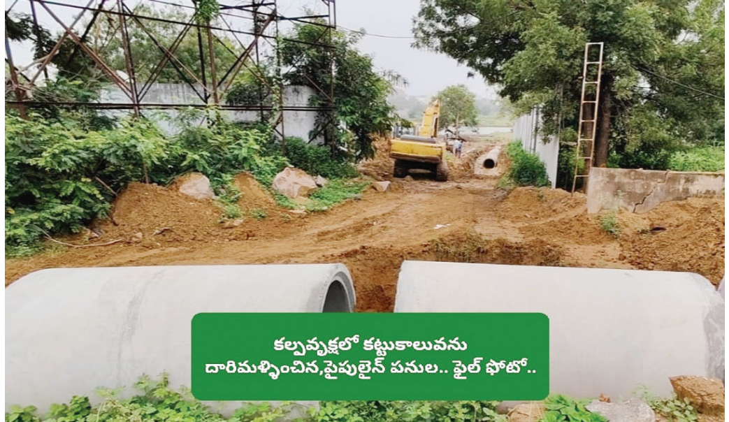
కల్వవృక్షలో కట్టుకాలువను దారిమళ్ళించిన, ఫైల్ ఫోటో..