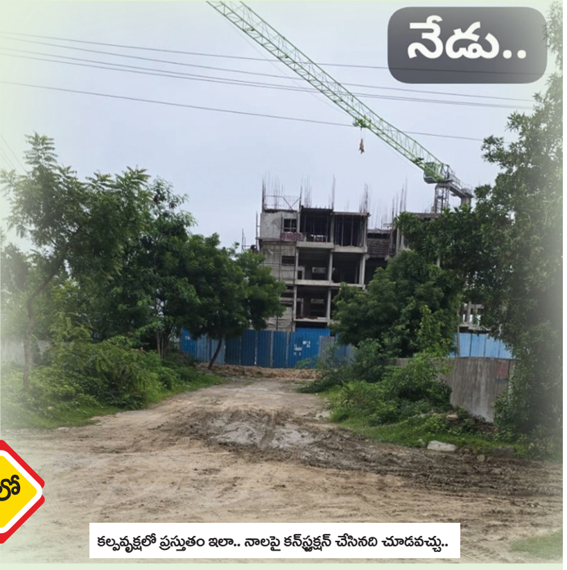
కల్వనూర్లో ప్రస్తుతం ఇలా.. నాలాపై కన్స్ట్రక్షన్ చేసినది చూడవచ్చు..