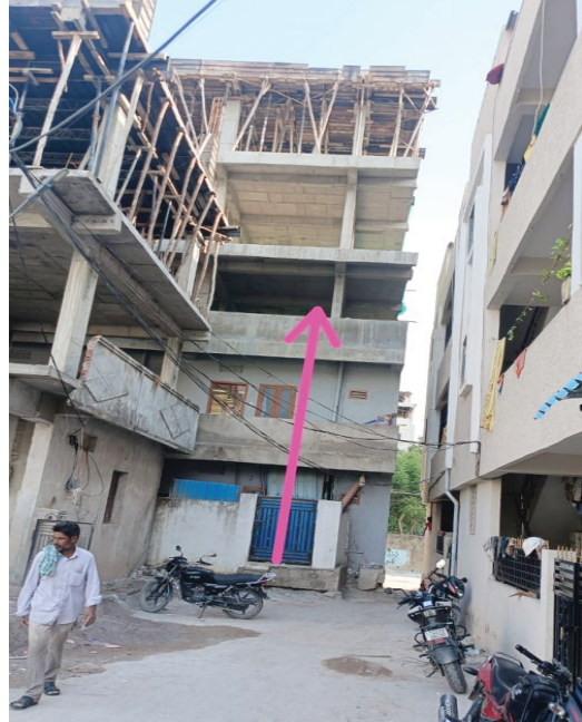
మాదాసు కాలనీలో చర్యలు తీసుకోని, అక్రమ నిర్మాణం..

వ్యవహారిస్తున్న వైసెపై స్థానికులు ఆగ్రహం వ్యక్తం చేస్తున్నారు..