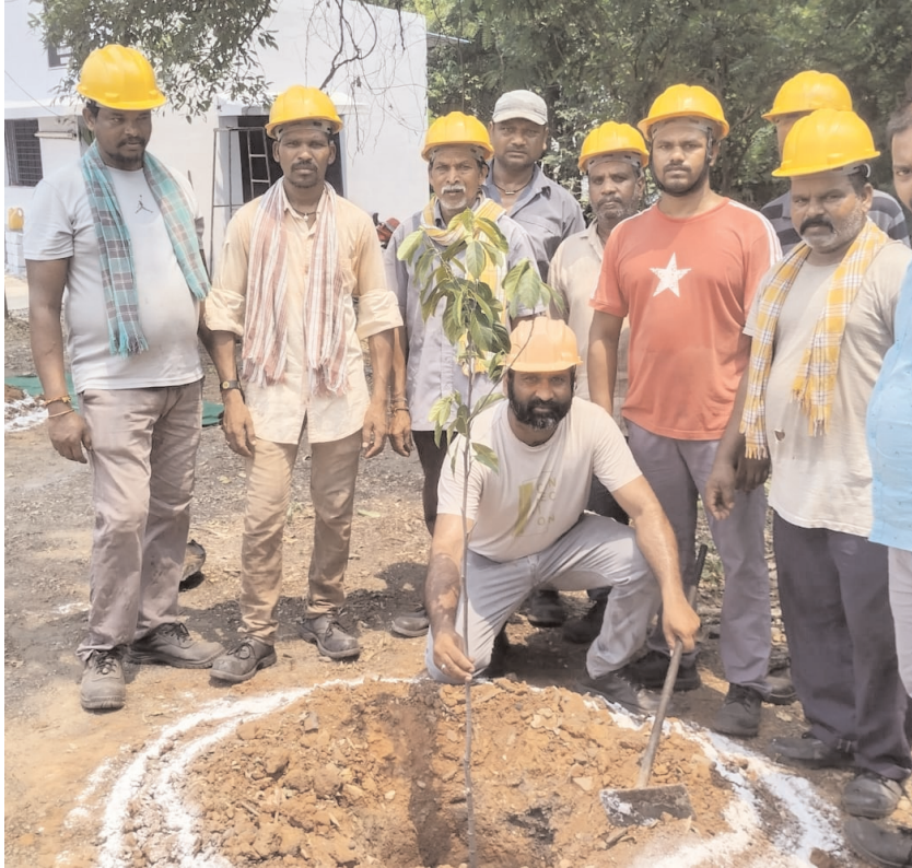
హైదరాబాద్ పెన్ పవర్: ప్రపంచ పర్యావరణ పరిరక్షణ దినోత్సవ సందర్భంగా సింగరేణి సిఎంఐ బలరాం స్ఫూర్తితో మొక్కలు నాటిన