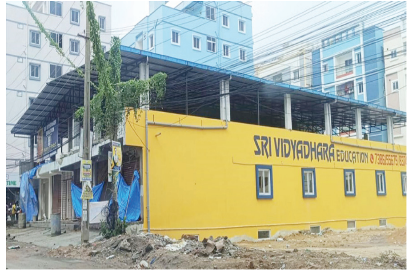
మల్లంపేట్ సాయిబాలాజీలో అక్రమ షెడ్డుపై చర్యలు శూన్యం..