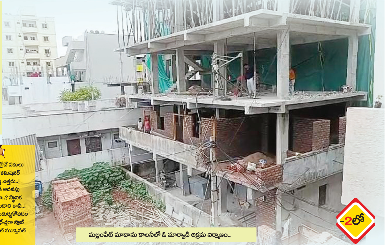
మల్లంపేట్ మాదాసు కాలనీలో ఓ మార్వాడి అక్రమ నిర్మాణం..