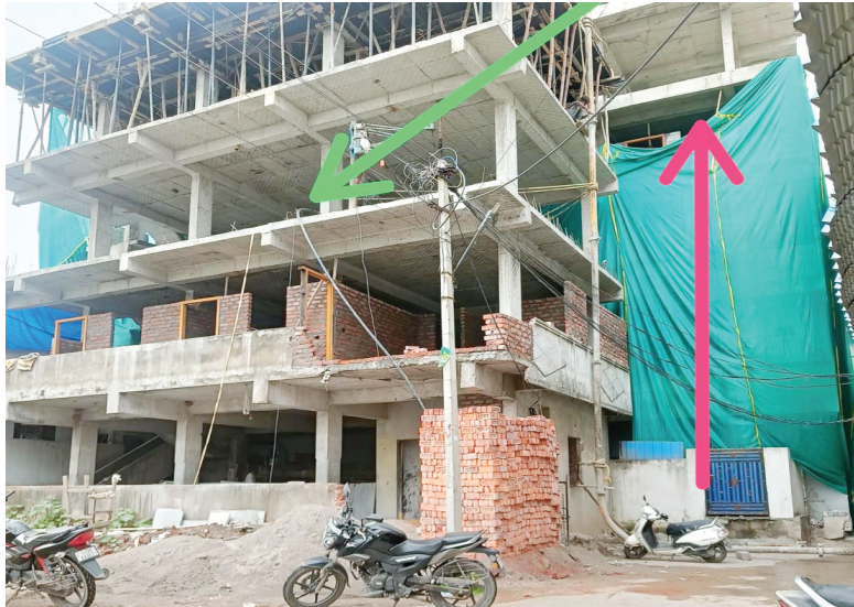
మాదాసు కాలనీలో ఒక చోట రెండు అక్రమ నిర్మాణాలు.. ఒకదానికి మాత్రమే శనివారం నోటీసు..