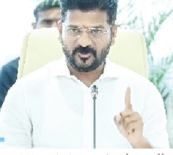
మనమంతా కలిసికట్టుగా నిలబడి... దేశాన్ని బలోపేతం చేసేందుకు పని చేయాలన్నారు. పార్టీని వీడిన నేతలు తిరిగి కాంగ్రెస్ లోకి రావాలంటూ ఉపముఖ్యమంత్రి ఇచ్చిన పిలుపుతో తాను నూటికి నూరు శాతం ఏకీభవిస్తున్నానని... పీసీసీ అధ్యక్షుడిగా సమర్థిస్తున్నానని అన్నారు.

హైదరాబాద్ పెన్ పవర్: కాంగ్రెస్ను వీడిన నేతలు అందరూ తిరిగి రావాలని తెలంగాణ ఉపముఖ్యమంత్రి మల్లు భట్టివిక్రమార్కు ఆహ్వానించారు... ఆ మాటలను సమర్థిస్తున్నట్లు ముఖ్యమంత్రి రేవంత్ రెడ్డి చెప్పారు. గాంధీ భవన్ లో వైఎస్ జయంతి వేడుకల సందర్భంగా జరిగిన కార్యక్రమంలో వీరు పాల్గొన్నారు. ఈ సందర్భంగా మాట్లాడిన భట్టివిక్రమార్కు... పార్టీని వీడిన నేతలను తిరిగి రావాలని కోరారు. ఆయన మాట్లాడుతూ... 'రండి... కలిసి పని చేద్దాం. సంక్షేమం కోసం ముందుకు నడుద్దాం. దూరంగా ఉన్న నాటి కాంగ్రెస్ నాయకులు అందరూ కూడా పార్టీలోకి రావాలని మనస్ఫూర్తిగా ఆహ్వానిస్తున్నానని పేర్కొన్నారు. ఇచ్చిన హామీలను కచ్చితంగా అమలు చేస్తామని పునరుద్ఘాటించారు. ప్రతి కాంగ్రెస్ కార్యకర్త, నాయకుడు గ్రామాల్లో తల ఎత్తుకొని తిరిగి ఈ ప్రభుత్వం పని చేస్తుందని మాట ఇస్తున్నామన్నారు. అనంతరం, ముఖ్యమంత్రి మాట్లాడుతూ... కేంద్రంలో కాంగ్రెస్ అధికారంలోకి వచ్చి... రాహుల్ గాంధీని ప్రధాని చేయడమే లక్ష్యంగా అందరూ కాంగ్రెస్ పార్టీలోకి రావాలని విజ్ఞప్తి చేశారు.