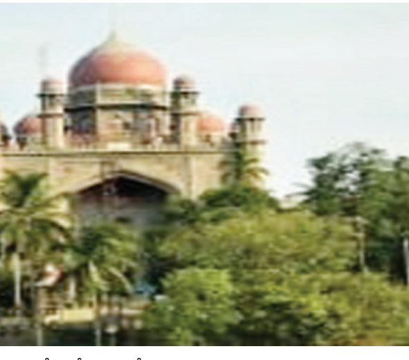
తీసుకోవడం లేదంటూ పిటిషన్ల తరపు న్యాయవాదులు కోర్టులో వాదనలు వినిపించారు. పార్టీ మారిన ఎమ్మెల్యేలపై మూడు నెలల్లో అనర్హత వేటు వేయాలన్న సుప్రీంకోర్టు తీర్పులను స్వీకర్త అమలు చేయడం లేదని హైకోర్టుకు తెలిపారు. వారి వాదనలు విన్న హైకోర్టు తదుపరి విచారణను గురువారానికి వాయిదా వేసింది.