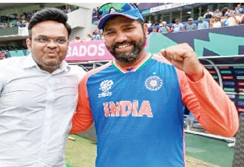
విజయపథంలో నడిపిస్తాడని నాకు గట్టి నమ్మకం ఉంది" అని జై షా వివరించారు. కాగా, టీ20 వరల్డ్ కప్ విజయాన్ని కోచ్ రాహుల్ ద్రావిడ్, రోహిత్ శర్మ, విరాట్ కోహ్లీ, రవీంద్ర జడేజాలకు అంకితం ఇస్తున్నట్లు జై షా ప్రకటించారు.

రోహిత్ శర్మ సారథ్యంలో టీ20 వరల్డ్ కప్ గెలిచిన టీమిండియా రాబోయే టెస్టు చాంపియన్ షిప్ పైనల్, చాంపియన్స్ ట్రోఫీ కూడా గెలుస్తామన్న జై షా రోహిత్ శర్మ నాయకత్వంపై తనకు నమ్మకం ఉందని వెల్లడి హైదరాబాద్ పెన్ పవర్: రోహిత్ శర్మ నాయకత్వంలోని టీమిండియా టీ20 వరల్డ్ కప్-2024ను కైవసం చేసుకోవడంపై టీసీసీఐ కార్యదర్శి జై షా స్పందించారు. రోహిత్ శర్మ కెప్టెన్సీ సంతృప్తికరంగా సాగుతోందని అన్నారు. రోహిత్ శర్మ సారథ్యంలో టీమిండియా రాబోయే వరల్డ్ టెస్టు చాంపియన్ షిప్ పైనల్లోనూ విజయం సాధిస్తుందని, అదే క్రమంలో చాంపియన్స్ ట్రోఫీలోనూ విజేతగా నిలుస్తుందని జై షా ధీమా వ్యక్తం చేశారు. "టీమిండియా టీ20 వరల్డ్ కప్-2024 ట్రోఫీని గెలుచుకుని బార్బాడోస్ లో త్రివర్ణ పతాకాన్ని ఎగరవేస్తుందని నేను రాజ్ కోట్ లోనే చెప్పాను. రోహిత్ శర్మ అది నిజం చేసి చూపించాడు. టీ20 వరల్డ్ కప్ పైనల్లో చివరి 5 ఓవర్ల నిర్ణయాత్మకంగా మారాయి. ఆఖరి ఓవర్లలో సూర్యకుమార్ యాదవ్, జస్టిన్ బుర్రూ, అర్జున్ సింగ్, హర్షిత్ షాన్ద్యా ప్రధాన పాత్ర పోషించారు. ఈ వరల్డ్ కప్ విజయం తర్వాత మా టారెట్ వరల్డ్ టెస్టు చాంపియన్ షిప్ పైనల్, ఆ తర్వాత చాంపియన్స్ ట్రోఫీ. ఈ రెండింటినీ రోహిత్ శర్మ టీమిండియాను