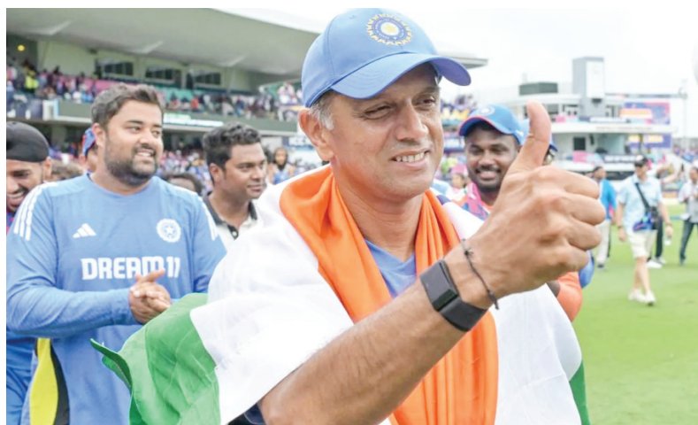
అనిపిస్తోంది. ద్రావిడ్ కు భారతరత్న ఇవ్వాలని కేంద్రాన్ని అడుగుదాం... మీరు కూడా నాతో జత కలుస్తారని అనుకుంటున్నా" అంటూ గవాస్కర్ పేర్కొన్నారు.

టీమిండియా టీ20 వరల్డ్ కప్ గెలవడం వెనుక రాహుల్ ద్రావిడ్ కృషి భారతరత్నకు ద్రావిడ్ అన్ని విధాలా అర్హుడన్న గవాస్కర్ ద్రావిడ్ కు భారతరత్న... ఈ మాట వింటుంటేనే అద్భుతంగా ఉందని వెల్లడి హైదరాబాద్ పెన్ పవర్: టీమిండియా టీ20 వరల్డ్ కప్ గెలవడంతో కోచ్ రాహుల్ ద్రావిడ్ పేరు కూడా మార్చేసిపోతోంది. భారత క్రికెట్లో అతిముఖ్యం అనడగ్గ వ్యక్తి రాహుల్ ద్రావిడ్. 'ది వాల్' అనే బిరుదుకు న్యాయం చేస్తూ, ఎన్నోసార్లు వికెట్ల పతనానికి అడ్డుగోడలా నిలిచిన ద్రావిడ్... అటగాడిగా అనేక ఘనతలు సాధించాడు. వాటన్నింటినీ మింపిపోయేలా కోచ్ గా వరల్డ్ కప్ ను సాధించి తన కెరీర్ ను చిరస్మరణీయం చేసుకున్నాడు. కాగా, ద్రావిడ్ కు భారతదేశ అత్యున్నత పురస్కారం భారతరత్న ఇవ్వాలని క్రికెట్ దిగ్గజం సునీల్ గవాస్కర్ అంటున్నారు. భారతరత్నకు ద్రావిడ్ అన్ని విధాలా అర్హుడని గవాస్కర్ స్పష్టం చేశారు. ద్రావిడ్ కు భారతరత్న ఇవ్వడం సబబుగా ఉంటుందని అభిప్రాయపడ్డారు. "కెప్టెన్ గానూ, అటగాడిగానూ ద్రావిడ్ ఎంతోనే సేవలు అందించాడు... నేషనల్ క్రికెట్ అకాడమీ చైర్మన్ గా యువ ప్రతిభావంతులను ఎంతోమందిని తెరపైకి తెచ్చాడు... టీమిండియా కోచ్ గా అద్భుతమైన ఫలితాలు అందించాడు... కెరీర్ లో ఎన్నడూ స్వార్థం చూపించలేదు. ద్రావిడ్ అన్ని వర్గాలను అలరించిన వ్యక్తి. రాహుల్ ద్రావిడ్ కు భారతరత్న... ఈ మాట వింటేనే అద్భుతంగా