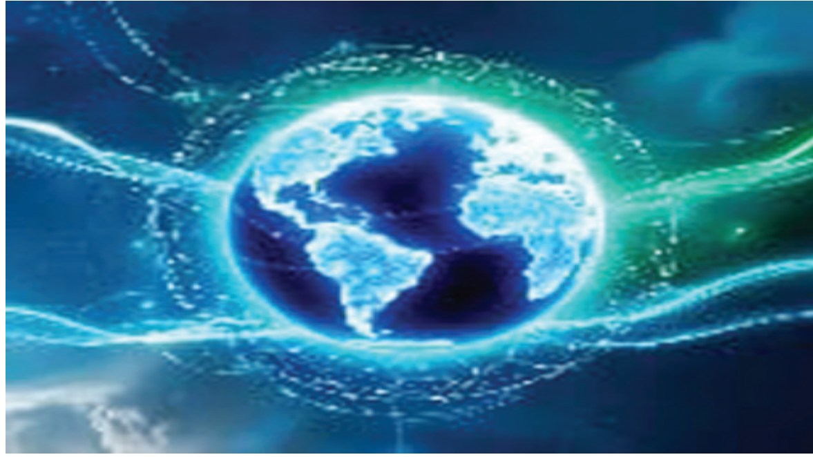
ఉన్న ఫైబర్ ఆప్టిక్ కేబుళ్ల ద్వారానే 402 టీబీపీఎస్ వేగం సాధించగలిగారు. అంటే కొత్తగా కేబుళ్లను మార్చాల్సిన అవసరం ఉండదు. కేవలం డేటాను ప్రసారం చేసే చోట, రిసీవ్ చేసుకునే చోట వినూత్న పరికరాలు, యాంప్లిఫయర్లను వాడితే చాలని శాస్త్రవేత్త ఇయోన్ ఫిలిప్స్ వెల్లడించారు. త్వరలోనే ఈ టెక్నాలజీ అందరికీ అందుబాటులోకి వస్తుందని ఆశిస్తున్నామని పేర్కొన్నారు.

ఆస్టన్ యూనివర్సిటీ శాస్త్రవేత్తలు ఇప్పుడు మార్కెట్లో అందుబాటులో