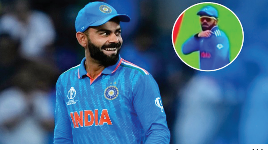
అనుసరించిన హైబ్రిడ్ విధానాన్నే చాంపియన్స్ ట్రోఫీలోనూ అనుసరించాలని టీసీసీ ప్రతిపాదిస్తున్న సంగతి విదితమే!

కోహ్లా కెరియర్ లో పాకిస్థాన్ టూర్ లేకుండా పోయిందన్న యూనిస్ ఖాన్ అతడొచ్చి పాక్ లో ఆడితే ఆ చుట్టూ కూడా తీరిపోతుందని వ్యాఖ్య కోహ్లా పాకిస్థాన్ లో ఆడాలనుకోవడం తమ కోరిక కూడా అని వెల్లడించిన మాజీ కెప్టెన్ హైదరాబాద్ పెన్ పవర్: ఐసీసీ చాంపియన్స్ ట్రోఫీ కోసం భారత జట్టు పాకిస్థాన్ లో పర్యటించాలని.. కోహ్లా పాక్ లో ఆడాలని పాకిస్థాన్ మాజీ కెప్టెన్ యూనిస్ ఖాన్ పేర్కొన్నాడు. కోహ్లా కెరియర్ లో పాక్ పర్యటన లోటుగా మిగిలిపోయిందని, అతడొచ్చి పాకిస్థాన్ లో ఆడితే చూడాలని ఉందని, అది తమ కోరిక అని చెప్పుకొచ్చాడు. "2025 చాంపియన్స్ ట్రోఫీకి విరాట్ కోహ్లా రావాలి. అది మా కోరిక కూడా. అతడొచ్చి పాకిస్థాన్ లో ఆడాలి. కోహ్లా కెరియర్ లో పాకిస్థాన్ టూర్ లేకుండా పోయింది. కాబట్టి ఈ ట్రోఫీ కోసం అతడొచ్చి ఇక్కడ ఆడాలి" అని యూనిస్ ఖాన్ పేర్కొన్నాడు. కోహ్లా 2008లో అంతర్జాతీయ కెరియర్ ప్రారంభించగా, అంతకు రెండేళ్ల ముందు అంటే 2006లో భారత జట్టు చివరిసారి పాక్ తో డ్యూయిటికే సిరీస్ ఆడింది. ఆ తర్వాత మరెప్పుడూ టీమిండియా పాక్ లో పర్యటించలేదు. ఇక, వచ్చే పాకిస్థాన్ ఐసీసీ చాంపియన్స్ ట్రోఫీకి ఆతిథ్యమిస్తోంది. భారత జట్టు ఈ టోర్నీలో పాల్గొనే అవకాశం కనుచూపు మేరలో కనిపించడం లేదు. దాదాపు దేశం వెళ్లేందుకు భారత జట్టుకు ప్రభుత్వం అనుమతిచ్చే అవకాశాలు దాదాపు లేవు. ఈ నేపథ్యంలో ఆసియా కప్ లో