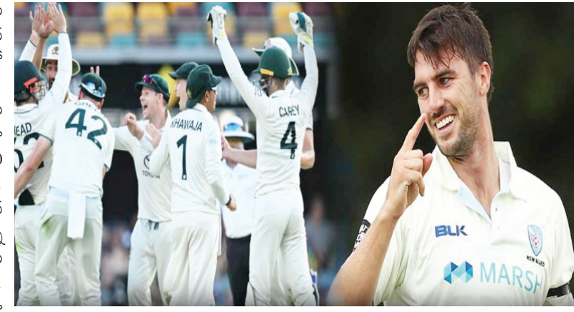
కెప్టెన్ అజింక్య రహానే సారథ్యంలో 2-1 తేడాతో సిరీస్ గెలుచుకుంది. చివరిసారిగా 2023 లో నాలుగు టెస్ట్ మ్యాచ్ ల సిరీస్ ను భారత్ 2-1 తేడాతో గెలుచుకోవడం విశేషం.

హైదరాబాద్ పెన్ పవర్: భారత్, ఆస్ట్రేలియా మధ్య జరగబోయే ప్రతిష్టాత్మకమైన బోర్డర్ గవాస్కర్ ట్రోఫీ 2024-25 టెస్ట్ సిరీస్ నవంబర్ 22 నుంచి జనవరి 3 వరకు జరుగుతుంది. పాల్ కమిన్స్ నేతృత్వంలోని ఐదు టెస్టుల సిరీస్ ఆడేందుకు భారత్ ఆస్ట్రేలియాలో పర్యటిస్తుంది. ఆస్ట్రేలియాలో జరిగిన చివరి రెండు బోర్డర్ గవాస్కర్ ట్రోఫీలు భారత్ గెలుచుకుంది. దీంతో ఈ సారి ఆస్ట్రేలియా సొంతగడ్డపై ఎలాగైనా ఈ ప్రతిష్టాత్మక సిరీస్ గెలుచుకోవాలని చూస్తుంది. దీని కోసం ఆస్ట్రేలియా స్ట్రా ఆటగాళ్లు దేశవాళీ క్రికెట్ ఆదారాలని నిర్ణయించుకున్నారు. ఆస్ట్రేలియాలో అత్యంత ప్రాముఖ్యమైన షెఫీల్డ్ షీల్డ్ సీజన్ ఆక్టోబర్ 8న ప్రారంభమవుతుంది. బోర్డర్ గవాస్కర్ ట్రోఫీ ముందు ఆసీస్ ప్రధాన ఆటగాళ్లు ఈ టోర్నీ ఆడేందుకు సిద్ధమయ్యారు. తొలి రెండు రౌండ్ లో ఆసీస్ కీలక ఆటగాళ్లు ఆడవన్నారు. ట్రావిస్ హెడ్, అలెక్స్ కార్, పాల్ కమిన్స్, మిచెల్ స్టార్క్, జోష్ షేజిలేవ్, నాథన్ లియోన్, స్టీవ్ స్మిత్, కామెరాన్ గ్రీన్ మరియు మిక్ మాల్స్ మార్నర్ లాంటివారిని ఈ లిస్టులో ఉన్నారు. నవంబర్ 4 నుంచి 18 వరకు సొంతగడ్డపై ఆస్ట్రేలియా మూడు వన్డే, మూడు డీ20 మ్యాచ్ లకు ఆతిథ్యమివ్వనుంది. ఈ సిరీస్ నమయానికి ఆసీస్ ఆటగాళ్లు షెఫీల్డ్ షీల్డ్ టోర్నీ ముగించుకొని అంతర్జాతీయ క్రికెట్ లోకి అడుగుపెడతారు. ఆస్ట్రేలియా గడ్డపై చివరగా జరిగిన రెండు టెస్టుల సిరీస్ ను భారత్ జట్టు గెలుచుకుంది. విరాట్ కోహ్లీ సారథ్యంలో భారత్ 72 ఏళ్లలో తొలిసారి 2-1 తేడాతో ఆసీస్ గడ్డపై సిరీస్ గెలిస్తే.. 2020-21లో తాత్కాలిక