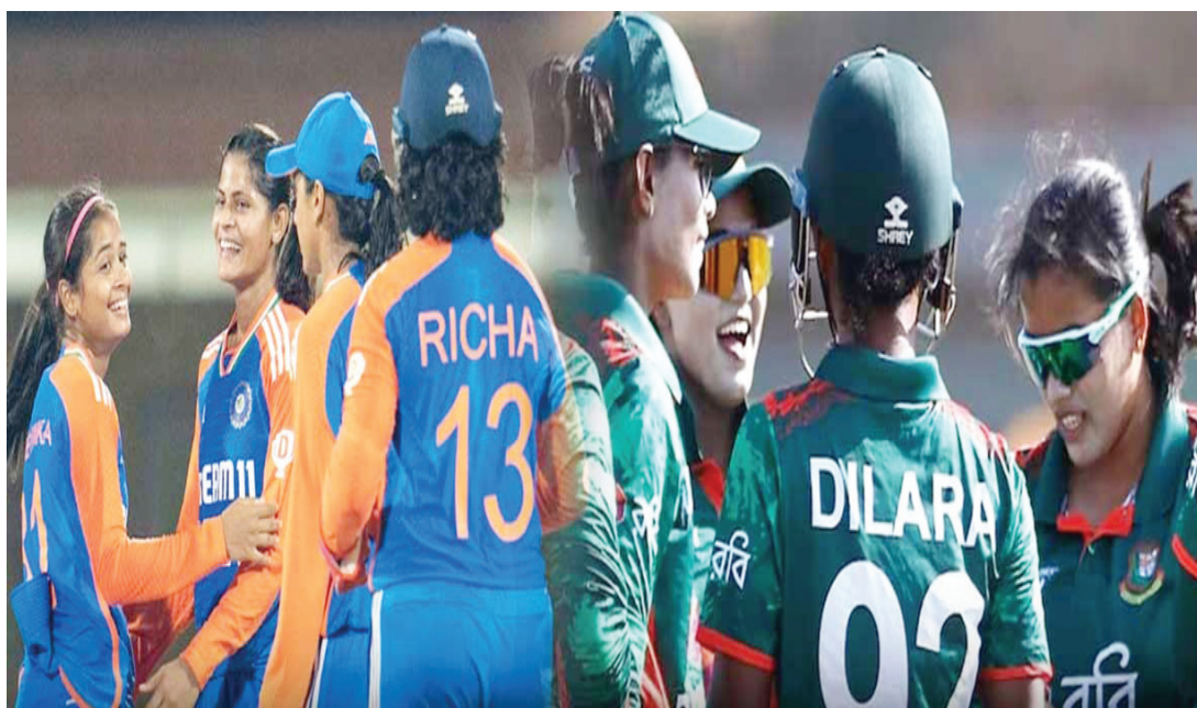
హైదరాబాద్ పెన్ పవర్: మహిళల ఆసియా కప్ లో హ్యూస్ట్రీక్ 82 రన్స్ తేడాతో నేపాల్ జట్టును చిత్తుగా ఓడించి టేబుల్ విక్టరీ సాధించిన డీమెండ్ యా సెమీఫైనల్ కు చేరుకుంది. టాపర్ గా నిలిచింది. ఇదే గ్రూప్ లో పాకిస్తాన్ ఆడిన మంగళవారం జరిగిన గ్రూప్ %-%ఎ చివరి మ్యాచ్ లో మూడు మ్యాచ్ లో 2 మ్యాచ్ లు గెలిచి మరో సెమీ ఫైనల్

బెర్ట్ ఖాయం చేసుకుంది. గ్రూప్ బి లో శ్రీలంక ఆడిన మూడు మ్యాచ్ లో గెలిచి అగ్ర స్థానంలో ఉంటే.. బంగ్లాదేశ్ రెండు విజయాలతో రెండో స్థానంలో నిలిచి సెమీస్ కు చేరుకుంది. రూల్స్ ప్రకారం గ్రూప్ ఏ లో టాపర్ గా నిలిచిన జట్టు గ్రూప్ బి లోని రెండో స్థానంలో నిలిచిన జట్టుతో ఆడాలి. అదే విధంగా గ్రూప్ ఏ లో రెండో స్థానంలో నిలిచిన జట్టు గ్రూప్ బి లో అగ్ర స్థానంలో నిలిచిన జట్టుతో మ్యాచ్ ఆడుతుంది. దీని ప్రకారం భారత్ బంగ్లాదేశ్ తో.. శ్రీలంక బంగ్లాదేశ్ తో సెమీ ఫైనల్లో తలపడాల్సి ఉంది. శుక్రవారం జరిగే సెమీఫైనల్ మ్యాచ్ లో ఇండియాతో బంగ్లాదేశ్ పాకిస్తాన్ తో శ్రీలంక తలపడతాయి. భారత్, బంగ్లాదేశ్ సెమీ ఫైనల్ మధ్యాహ్నం 2 గంటలకు.. బంగ్లాదేశ్, పాకిస్తాన్ సెమీ ఫైనల్ మ్యాచ్ సాయంత్రం 7 గంటలకు ప్రారంభమవుతుంది. ఫైనల్ ఆదివారం (జూలై 28) జరుగుతుంది. 8 జట్ల మధ్య మహిళల ఆసియా టోర్నీ నిర్వహించగా.. నేపాల్, యూఏఈ, థాయిలాండ్, మలేసియా జట్లు ఇంటిదారి పట్టాయి. వీటిలో థాయిలాండ్, నేపాల్ ఒక మ్యాచ్ లో గెలిస్తే.. యూఏఈ, మలేసియా ఆడిన మూడు మ్యాచ్ లో ఓడిపోయాయి.