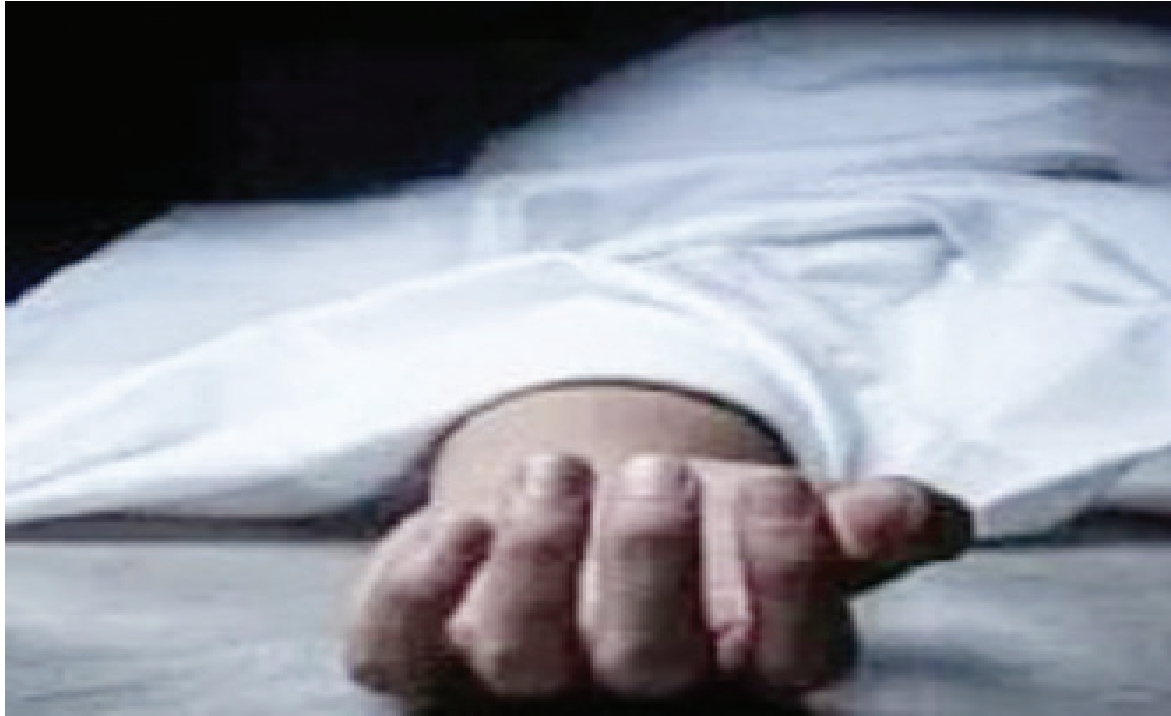
వైద్యాధికారుల సంఘం ఖండించింది. ఉదర సంబంధిత సమస్యలతో బాధపడే రోగులకు ఇచ్చే సాధారణ ఇంజెక్షన్ అనాఫిలాక్సిస్ను వైద్యుడు ఇచ్చాడని ఆరోపియేషన్ పేర్కొంది. తీవ్రమైన అల్లర్ల కారణంగా రియాక్షన్ వచ్చి మహిళా చనిపోయి ఉండొచ్చని, ఇది వైద్యుడి నిర్లక్ష్యమని చెప్పలేమని ఆరోపియేషన్ పేర్కొంది.