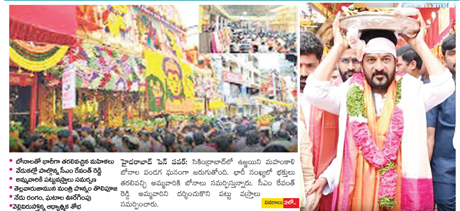
బోనాలలో భారీగా తరలివచ్చిన మహిళలు హైదరాబాద్ పెన్ పవర్: సికింద్రాబాద్ లో ఉజ్జయిని మహాంకాళి బోనాల వందగ ఘనంగా జరుగుతోంది. భారీ సంఖ్యలో భక్తులు తరలివచ్చి అమ్మవారికి బోనాలు సమర్పిస్తున్నారు. సీఎం రేవంత్ రెడ్డి అమ్మవారిని దర్శించుకొని పట్టు వస్త్రాలు