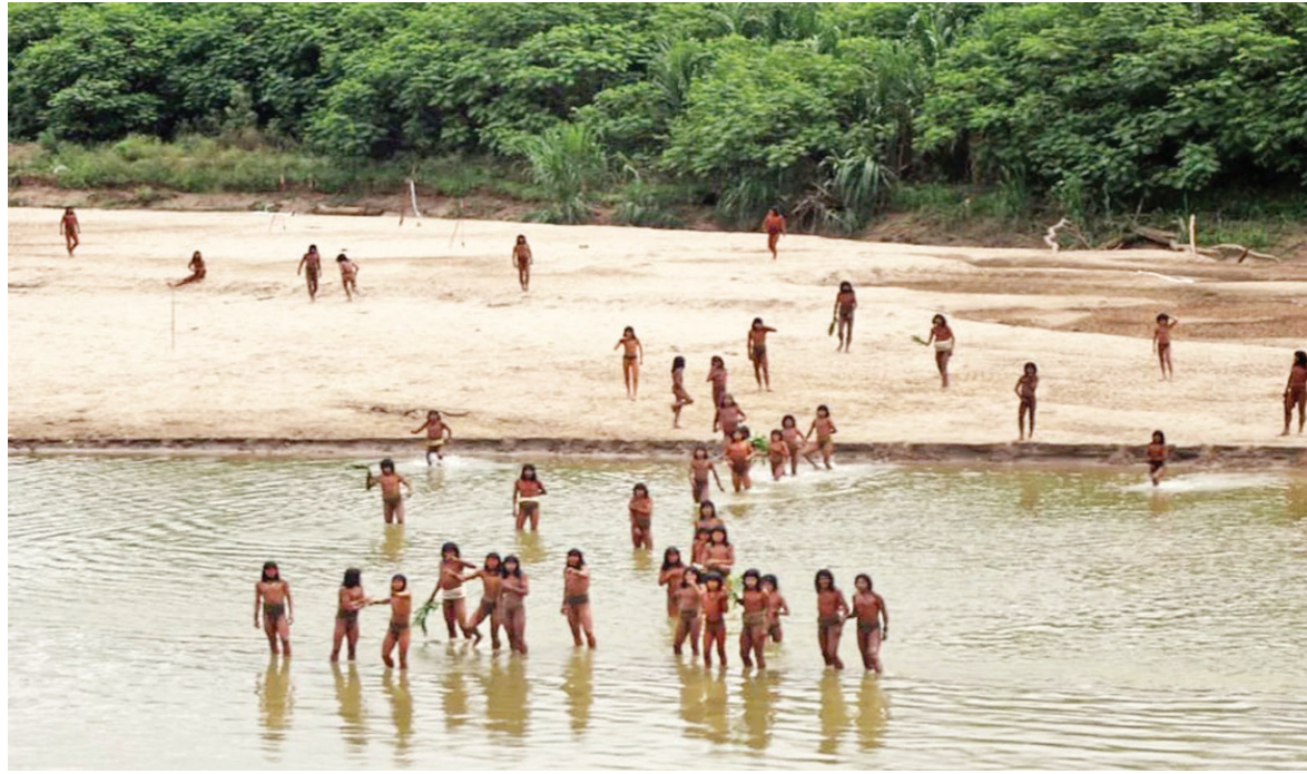
విఫలమవడమే కాకుండా లాంగింగ్ కంపెనీలకు కంటికి చిక్కింది. ఈ తెగవారు బయటకు రావడంతో ఈ ప్రాంతాన్ని విక్రయించిన అయన ఆరోపించారు. స్థానికులకు, వారికి మధ్య పోరాటాలు జరిగే అవకాశం ఉందని పియో ఆందోళన వ్యక్తం చేశారు.

పెరువియన్ అమెజాన్లో సంవరిస్తున్న మాచిగో పైరోగా గుర్తింపు బాహ్య ప్రపంచంతో సంబంధాలు లేని అతిపెద్ద స్వదేశీ సమూహం ఇదే ఆహారం కోసం అన్వేషిస్తూ లాస్ పీడ్రాస్ నది తీరానికి