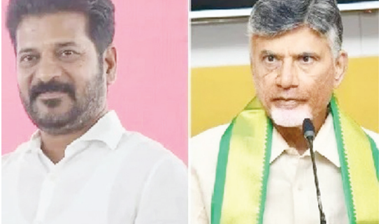
విభజన సమస్యలను పరిష్కరించుకోవడమే ఏకైక అజెండాగా ఇరు తెలుగు రాష్ట్రాల ముఖ్యమంత్రులు చంద్రబాబు, రేవంత్ రెడ్డి కాసేపట్లో భేటీ కాబోతున్నారు. హైదరాబాద్ లోని