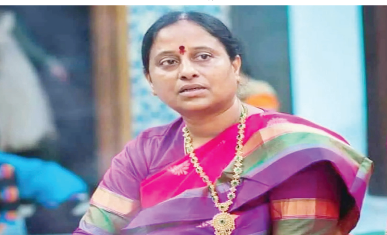
ప్రారంభం కానున్నట్లు తెలిపారు. బోనాల ఉత్సవాలను ఘనంగా జరిపేందుకు