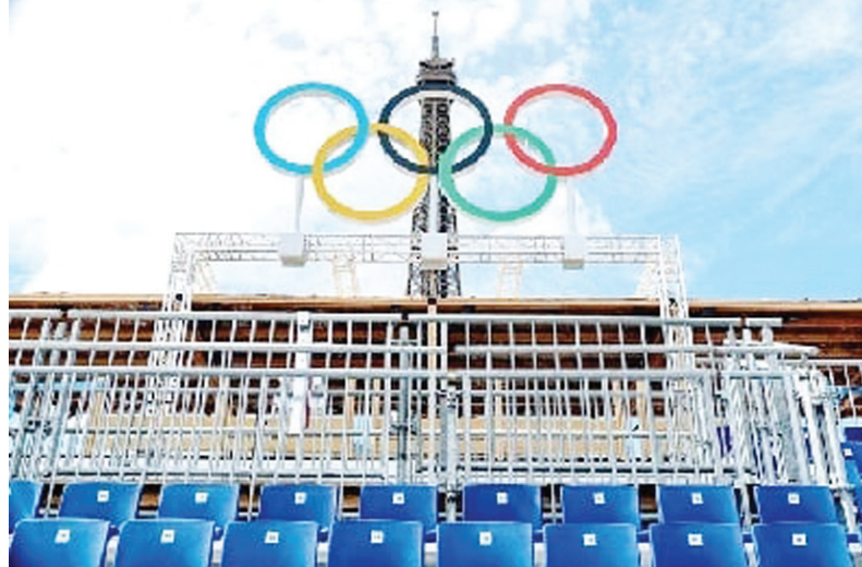
క్రీడాంశాల్లో పతకాలపై ఆశలు కలుగుతున్నాయి. ప్రధానంగా భారత్ రెజింగ్, వెయిట్ లిఫ్టింగ్, బాక్సింగ్, బ్యాడ్మింటన్, హాకీ, ఆర్చరీ క్రీడాంశాల్లో పతకాలను ఆశిస్తోంది.