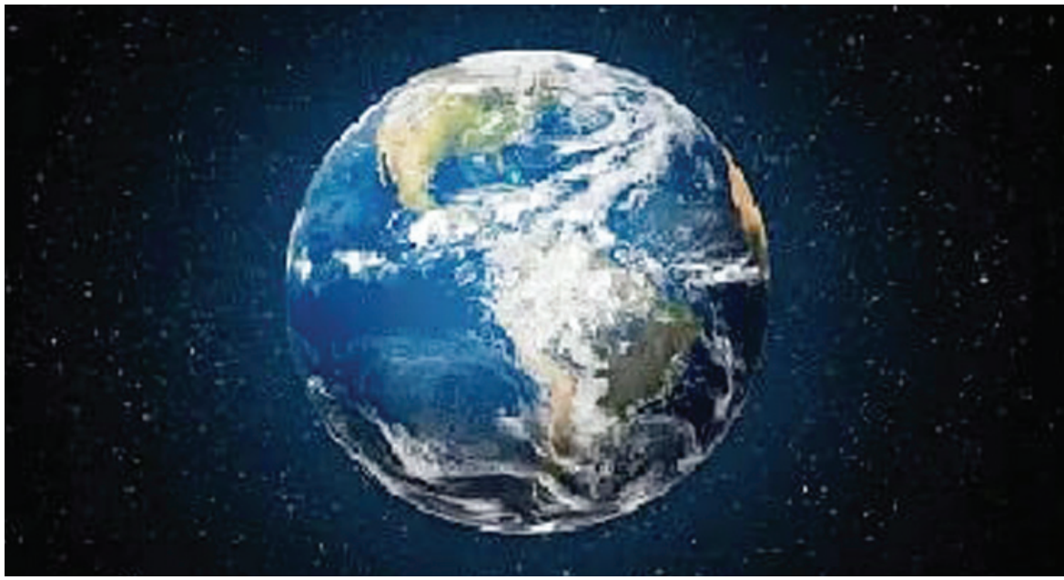
పరిశోధకులు గుర్తించారు. వాతావరణ మార్పులు తీవ్రమైన హెచ్చరించారు. వాతావరణ మార్పులు భూగ్రహంపై తీవ్రమైన ప్రభావం చూపించే అవకాశం ఉందని బెనెడిక్ట్ సోజా ప్రభావాన్ని చూపిస్తాయని అన్నారు.

మానవ ప్రేరేపిత వాతావరణ మార్పులు భూగ్రహాన్ని ప్రభావితం చేస్తున్నాయి. అనేక మార్పులకు కారణమవుతున్నాయి. ఏకంగా భూ భ్రమణం మారుతోందని నూతన అధ్యయనం వెల్లడించింది. వాతావరణ మార్పు భూమి అక్షం మార్పునకు కూడా దారితీస్తోందని స్విట్జర్లాండ్లోని ఈటీహెచ్ జ్యూరిచ్ యూనివర్సిటీ నూతన పరిశోధన పేర్కొంది. ద్రువపు మంచు కరగడంతో, ఈ నీరు భూమధ్యరేఖ వైపు ప్రవహిస్తోందని, పర్యవసానంగా భూగ్రహం ద్రవ్యరాశి పంపిణీ జరుగుతోందని, గ్రహం భ్రమణ వేగాన్ని తగ్గిస్తోందని అధ్యయనం పేర్కొంది. పగటి సమయం కొన్న ఎక్కువగా ఉండేందుకు ఈ పరిణామం దారితీస్తుందని వివరించింది. ఈ మేరకు 'నేచర్ జియోసైన్స్'లో అధ్యయనాన్ని ప్రచురించింది. కాగా ఈ నూతన అధ్యయనానికి నాయకత్వం వహించిన ప్రొఫెసర్ బెనెడిక్ట్ సోజా స్పందిస్తూ.. వ్యక్తులు తమ చేతిని చాచి తిప్పుతున్న సదృశ్యానికి ఉదాహరణగా వివరించారు. భూమి ద్రవ్యరాశి అక్షం నుంచి దూరంగా కదిలినప్పుడు భ్రమణ వేగం పెరుగుతుందని, ద్రవ్యరాశి రివర్స్ లో పంపిణీ అయినప్పుడు భ్రమణం నెమ్మదిస్తుందని వివరించారు. సాధారణంగా చంద్రుడి గురుత్వాకర్షణ శక్తి ప్రభావం భూమిపై ప్రబలమైంది. అయితే మంచుపలు కర్రను ఉద్ధారాలను ఇదే స్థాయిలో నిరంతరాయంగా కొనసాగిస్తే వాతావరణ మార్పులు చంద్రుడి ప్రభావాన్ని కూడా అధిగమించి ప్రభావం చూపగలవని