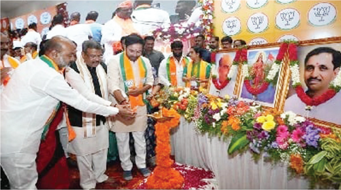
చేసిందని మండిపడ్డారు. తెలంగాణ అభివృద్ధికి కేంద్రం కట్టుబడి ఉందన్నారు. కాంగ్రెస్-బీఆర్ఎస్లకు నిర్ణయం వచ్చినట్లు బీజేపీ కార్యకర్త సామరస్యంగా పరిష్కారం చేయాలని సూచించారు. టాప్ 5 ఫస్ట్ స్టాంలోకి వస్తుందని సమావేశానికి హాజరైన నేతలను ఎకనామిక్ సిటీస్లో హైదరాబాద్ ఉందన్నారు.

నరేంద్రమోదీ ప్రధానిగా ఉన్న రోజులు రిజర్వేషన్లకు ఎలాంటి ధోకా ఉండదని కేంద్రమంత్రి ధర్మేంద్ర ప్రధాన్ స్పష్టం చేశారు. శంషాబాద్ లో నిర్వహించిన తెలంగాణ రాష్ట్ర బీజేపీ విస్తృతస్థాయి కార్యవర్గ సమావేశంలో ఆయన మాట్లాడుతూ... కాంగ్రెస్ రాజ్యాంగాన్ని తరచూ అవమానపరుస్తోందన్నారు. ఎన్డీయే అధికారంలో ఉన్న రోజులు రాజ్యాంగాన్ని మార్చే ప్రసక్తి లేదన్నారు. తెలంగాణలోని కాంగ్రెస్ ప్రభుత్వం హిందూ విరోధి అని ఆరోపించారు. ప్రత్యేక తెలంగాణ కోసం బీజేపీ మద్దతిచ్చిందని గుర్తు చేశారు. బీజేపీలో సామాన్య కార్యకర్త ముఖ్యమంత్రి అయ్యే అవకాశం ఉంటుందన్నారు. రాష్ట్రంలో బీజేపీ అధికారంలోకి వస్తే సామాన్యదే ముఖ్యమంత్రి అవుతారని జోస్యం చెప్పారు. బీజేపీలో చేరిన వారంతా పాత నాయకులే అన్నారు. ఈటల రాజేందర్ పార్టీలో కొత్త నాయకుడు కాదని... ఆయన పాత నేత అయిపోయారన్నారు. దక్షిణ భారతంలో బీజేపీ బలపడిందన్నారు. తెలంగాణ, ఏపీలో గతంలో కంటే మంచి సీట్లు గెలుచుకున్నామని, కేరళలో బీజేపీ ఖాతా తెరిచిందని, తమిళనాడులో మెరుగైన ఓటు బ్యాంక్ సాధించామన్నారు. తెలంగాణలో బీజేపీని సెంటర్ పస్ పార్టీగా మార్చేందుకు తమ వద్ద 1500 రోజుల ప్రణాళిక ఉందని తెలిపారు. రాష్ట్రంలో పోలింగ్ బూత్ లెవెల్లో బీజేపీని మరింత బలపర్చాల్సి అవసరం ఉందన్నారు. పార్టీలో కొత్త పాత లేదని తెల్పి చెప్పారు. గత పదేళ్లుగా ఒక కుటుంబం తెలంగాణ రాష్ట్రాన్ని నాశనం