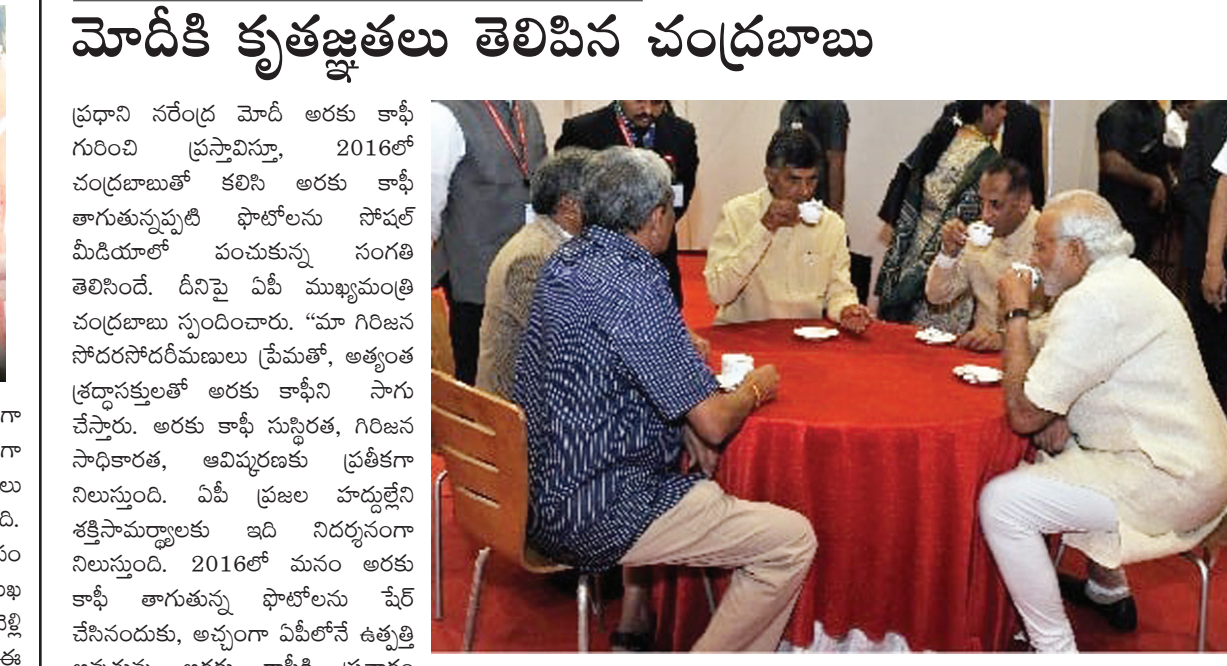
మోదీకి కృతజ్ఞతలు తెలిపిన చంద్రబాబు ప్రధాని నరేంద్ర మోదీ అరకు కాఫీ గురించి ప్రస్తావిస్తూ, 2016లో చంద్రబాబుతో కలిసి అరకు కాఫీ తాగుతున్నప్పటి ఫోటోలను సోషల్ మీడియాలో పంచుకున్న సంగతి తెలిసిందే. దీనిపై ఏపీ ముఖ్యమంత్రి చంద్రబాబు స్పందించారు. “మా గిరిజన సోదరసోదరీమణులు ప్రేమతో, అత్యంత శ్రద్ధాసక్తులతో అరకు కాఫీని సాగు చేస్తారు. అరకు కాఫీ సుస్థిరత, గిరిజన సాధికారత, అవిచ్ఛరణకు ప్రతీకగా నిలుస్తుంది. ఏపీ ప్రజల హృదయాలను శక్తిసామర్థ్యాలకు ఇది నిదర్శనంగా నిలుస్తుంది. 2016లో మనం అరకు కాఫీ తాగుతున్న ఫోటోలను షేర్ చేసినందుకు, అచ్చంగా ఏపీలోనే ఉత్పత్తి అవుతున్న అరకు కాఫీకి ప్రచారం కల్పిస్తున్నందుకు థాంక్యూ ప్రధానమంత్రి నరేంద్ర మోదీ గారు. మీతో మరో కష్ట తాగాలను ఎంజాయ్ చేయాలని ఎదురుచూస్తున్నాను” అంటూ సీఎం చంద్రబాబు ట్వీట్ చేశారు.