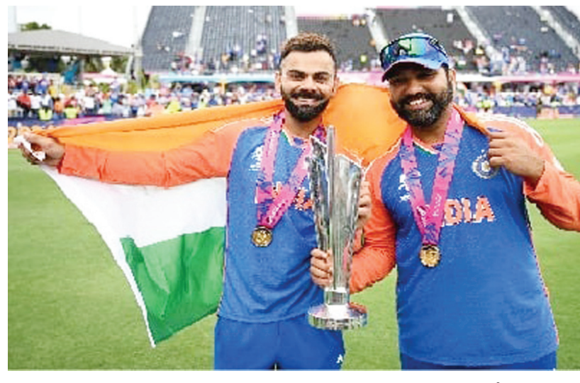
పేరుపొందావో గత రాత్రి నీ ఆట చూస్తే అర్థమవుతుంది. ఆరు వరల్డ్ కప్ లో టీమిండియాకు ప్రాతినిధ్యం వహించి, వివరి ప్రయత్నంలో వరల్డ్ కప్ సాధించడం ఎంతటి మధురానుభూతిని కలిగిస్తుందో నాకు కూడా తెలుసు. ఇకమీదట నువ్వు టెస్టులు, వన్డేలో టీమిండియాకు విజయాలు అందించేందుకు పాటుపడతావని ఆశిస్తున్నాను" అంటూ సచిన్ పేర్కొన్నారు.

ఇరువురికి శుభాకాంక్షలు తెలిపిన సచిన్ టెండూల్కర్ టీ20 వరల్డ్ కప్ గెలిచిన వెంటనే టీమిండియా దిగ్గజాలు విరాట్ కోహ్లా, రోహిత్ శర్మ టీ20 ఫార్మాట్ కు రిటైర్మెంట్ ప్రకటించిన సంగతి తెలిసిందే. దీనిపై భారత క్రికెట్ దేవుడు సచిన్ టెండూల్కర్ స్పందించారు. కెరీర్ ను ఘనంగా ముగించారని సచిన్ కొనియాడారు. రోహిత్ శర్మ, విరాట్ కోహ్లాను ఉద్దేశించి తన అభిప్రాయాలను ఎక్స్ లో పంచుకున్నారు. "రోహిత్ శర్మ... నువ్వు ప్రతిభావంతుడైన యువ ఆటగాడిగా కెరీర్ ప్రారంభించినప్పటి నుంచి వరల్డ్ కప్ గెలిచిన కెప్టెన్ గా ఎదిగేంత వరకు నీ ప్రస్థానాన్ని దగ్గర్నుంచి చూస్తూనే ఉన్నాను. నీ అచంచలమైన నిబద్ధత, ప్రత్యేకమైన నైపుణ్యం దేశానికి అత్యంత గర్వకారణంగా నిలిచాయి. నీ తిరుగులేని కెరీర్ కు టీ20 వరల్డ్ కప్ విజయంతో ముగింపు పలకడం వరల్డ్ క్లాస్ సరిపోయింది. వెల్డెన్ రోహిత్" అంటూ సచిన్ రోహిత్ శర్మను ఉద్దేశించి వ్యాఖ్యానించారు. సచిన్ అదే టీవీలో విరాట్ కోహ్లాని ఉద్దేశించి కూడా స్పందించారు. "విరాట్ కోహ్లా... క్రికెట్ ఆటలో నిజమైన చాంపియన్ అంటే నువ్వే. ఈ టోర్నమెంట్ మొదట్లో నువ్వు కొన్ని గడ్డు పరిస్థితులు ఎదుర్కొన్నావు. కానీ, ఈ జెంటిల్మన్ క్రికెట్ నువ్వు ఎందుకు గొప్ప ఆటగాళ్లలో ఒకడిగా