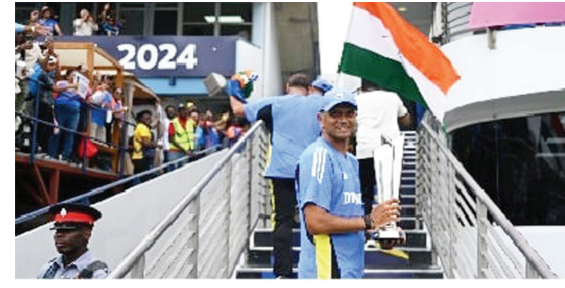
అవకాశాలు ఉంటే చెప్పండి" అంటూ ద్రావిడ్ చమత్కరించారు. టీమిండియా కోచ్ గా రాహుల్ ద్రావిడ్ కు ఈ టీ20 వరల్డ్ కప్ టోర్నీనే వివరి అసైన్ మెంట్ అని తెలిసిందే. ఈ టోర్నీతో టీమిండియా కోచ్ గా ద్రావిడ్ పదవీకాలం ముగిసింది. ద్రావిడ్ వారసుడిగా గౌతమ్ గంభీర్ కోచ్ గా వచ్చే అవకాశాలు మెదురుగా ఉన్నాయి.

రోహిత్ శర్మ నాయకత్వంలోని భారత క్రికెట్ జట్టు టీ20 వరల్డ్ కప్ గెలిచిన అనంతరం హెడ్ కోచ్ రాహుల్ ద్రావిడ్ ను మీడియా పలకరించింది. ఆటగాడిగా లభించని అదృష్టం తాను కోచ్ గా ఉన్నప్పుడు వరించినది చెబుతూ సంతోషంతో ఉప్పొంగిపోయాడు. "ఓ ఆటగాడిగా నేను అత్యుత్తమ ఆటగాడిగా కనబరిచినప్పటికీ వరల్డ్ కప్ గెలిచే అదృష్టానికి నోచుకోలేదు. ఆ తర్వాత జట్టుకు కోచ్ గా వ్యవహరించే అవకాశం తలుపుతట్టింది. నా అదృష్టం కొద్దీ ఈ కుర్రాళ్ల జట్టు నాకోసం ట్రోఫీ గెలిచింది. ఈ భావన ఎంతో గొప్పగా ఉంది. వరల్డ్ కప్ గెలిస్తే చాలా... ఇక తప్పుకుండా అని ఎప్పుడూ లక్ష్యంగా పెట్టుకోలేదు. ఇది నా వృత్తి అనుకున్నాను. ఏదేమైనా ఇదొక అదృతమైన ప్రస్థానం. ఇక, వచ్చే వారం నుంచి నేను నిరదృశ్విని... ఏమైనా