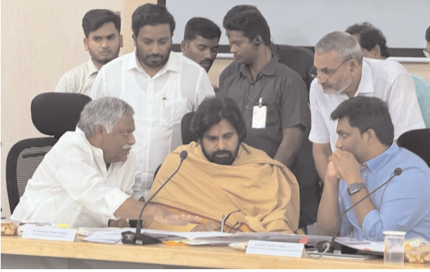
నియోజకవర్గంలో అనేక సమస్యలు ఉప ముఖ్యమంత్రి పవన్ కళ్యాణ్ కు, జిల్లా కలెక్టర్ షాన్ మోహన్ సగిలి దృష్టికి తీసుకెళ్లారు.

● ఉప ముఖ్యమంత్రి పవన్ కు విన్నవించిన ఎమ్మెల్యే నెహ్రూ జగ్గంపేట, పెన్ పవర్, జూలై 2 : జగ్గంపేట నియోజకవర్గంలో నెలకొన్న సమస్యలపై ప్రత్యేక దృష్టి పెట్టాలని ఉప ముఖ్యమంత్రి పవన్ కళ్యాణ్ కు జగ్గంపేట ఎమ్మెల్యే జ్యోతుల నెహ్రూ విన్నవించారు. కాకినాడ కలెక్టరేట్ లో మంగళవారం కాకినాడ జిల్లా ఎమ్మెల్యేలు, ఉన్నతస్థాయి అధికారులతో జిల్లాలో సమస్యలపై సమీక్షా సమావేశం ఏర్పాటు చేశారు. ఈ కార్యక్రమంలో పాల్గొన్న జగ్గంపేట శాసనసభ్యులు జ్యోతుల నెహ్రూ నియోజకవర్గంలో ఇరిగేషన్ సమస్యలపై వివరించారు. ముఖ్యంగా తాళ్లూరు లిఫ్ట్ మరమ్మతులు పూర్తిస్థాయిలో చేసి మెట్ల ప్రాంత రైతులను ఆదుకోవాలన్నారు. నియోజకవర్గంలో అధ్వానంగా ఉన్న రోడ్లన్నీ పూర్తి చేయించాలని ఎమ్మెల్యే నెహ్రూ ఉప ముఖ్యమంత్రి పవన్ కళ్యాణ్ ను కోరారు. ఏలేరు ఆధునీకరణ పై ఇరువురు చర్చించుకున్నారు.