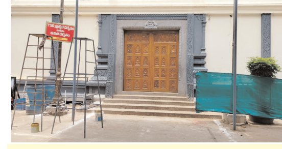
● ఆలయ దిసి పై శాఖావరమైన చర్యలు తీసుకోవాలని ఉన్నతాధికారులకు భక్తులు షెరాయ

ఆత్మీయపురం పెన్ పవర్ జూలై 2: డాక్టర్ బి.ఆర్ అంజేద్గర్ కోసనీమ జిల్లా ఆత్మీయపురం మండలం వాడపల్లి గ్రామంలో వెలిసిన ఏడువారాల వెంకన్న దేవుడుగా విరజిల్లుతున్న ఆలయ సన్నిధిలో మంగళవారం వివాదం నెలకొంది. వెంకన్న ఆలయ ఉత్తర దక్షిణ ద్వారాలు అకస్మాత్తుగా మూసివేయడంతో డిప్యూటీ కమిషనర్ పై భక్తులు ఆగ్రహం వ్యక్తం చేశారు. రాష్ట్ర స్థాయిలో ప్రత్యేక గుర్తింపు పొందిన ఆలయం శనివారం ఒక్కరోజే 50 వేల నుండి 75 వేల వరకు భక్తులు ఆలయానికి తరలి వస్తున్నారు. పవిత్రమైన పుణ్యక్షేత్రంలో ఇలాంటి సంఘటన జరగడం విడ్డూరంగా ఉందని హిందువుల మహాభావాల దెబ్బతినేలా ఆలయ వాస్తును తుంగలో త్రొక్కేలా డిప్యూటీ కమిషనర్