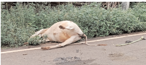
వైరామవరం, పెన్ పవర్, జూలై 6 : శుక్రవారం రాత్రి వనసల పాలెం గ్రామం వద్ద బస్సు ఢీకొట్టడంతో ఆవు మృతి చెందిందని ప్రత్యక్ష సాక్షులు తెలిపారు.

ఏజెస్టిలో వేసవిలో పశువులను కాపు కాయకపోవడంతో రవాణాలో పైనే ఆవాసాలు ఏర్పాటు చేసుకుంటూయిని పలువురు అంటున్నారు. అదేవిధంగా శుక్రవారం రాత్రి ఏలేశ్వరం నుండి వై. రామవరం వైల్డ్ హాట్ బస్సు రోడ్డుపై ఉన్న పశువులను తప్పించబోయి, ఒక పశువును ఢీకొట్టడం జరిగిందని తెలిపారు. బస్సు ఎడమవైపు ఉన్న ఆవు కనిపించకపోవడంతో ఢీ కొట్టారని, పశువు అక్కడికిక్కడే మృతి చెందిందని తెలిపారు. రవాణాలోపై పశువులు ఆవాసాలు, వర్షంవచ్చే అధికారులు అనే శీర్షికన పెన్ పవర్ దినపత్రికలో పలు కథనాలు వచ్చిన అధికారులు స్పందించక పోవడం విశేషం. అదే విధంగా రైతులు కూడా పశువులను కట్టుకోవాల్సిన బాధ్యత ఎంతైనా ఉందని పరువులు కోరుతున్నారు.