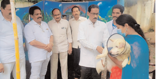
పాలు వైద్య సిబ్బంది పాల్గొన్నారు.