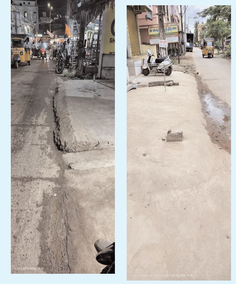
ఇబ్బందులు ఎదుర్కొంటున్నామంటూ, ప్రయాణికులు

అమలాపురం రూరల్, పెన్ పవర్, జూలై, 26 అమలాపురం పట్టణం లో కట్టల ల కొరల్లో కూరుకుపో తుంది అనడానికి ఇదొక ఉదాహరణ చెప్పొచ్చు. పట్టణం లోని ఈడరపల్లి గణపతి సెంటర్ నుండి హనుమన్ థియేటర్ దాకా వున్న సీసీ రోడ్డును ఎవరిష్టం వచ్చినట్టు వారు రోడ్డు మీద ప్లాట్లూమ్ కట్టించేస్తున్నారు. అటు వెళ్లే వారికి ఇటు వచ్చే వారికి చాలా ఇబ్బందికరంగా ఉంటుంది. స్కూల్ సమయాలలో ఈ రోడ్డు చాలా రద్దీగా ఉంటుంది. ఇదే దారిలో రోజూ కలెక్టర్ వెళ్తూ ఉంటారు. ఇదే దారిలో ఇద్దరు వార్డు మెంబర్లు ఇల్లులు ఉన్నాయి. గణపతి థియేటర్ వద్ద నుంచి సత్యేష్వర్ తల్లి గుడి దాకా రోడ్డు కి ఇరువకట్ల ఆటోలు, బడ్డీలు, పాత ఇసుక కొట్టు సామాగ్రి రోడ్డు మీదే దర్జునం ఇస్తాయి. ఇదే దారిలో అధికారులు నాయకులు వెళ్తూ ఉన్నా గానీ వారు చూసి చూడలేనట్టు పదిలేస్తున్నారు. ఇవి ప్రయాణికులకు చాలా ఇబ్బందికరంగా మారింది అని స్థానికులు అంటున్నారు. దానికి తగ్గట్టు ఇదే రోడ్డు లో ఒక థియేటర్ సైకిల్ స్టాండ్ వారు దౌర్జన్యంగా గ్రామం గోడ వగలగొట్టి ట్రాఫిక్ ను ఇటు మళ్ళించారు. దానివల్ల థియేటర్ లో సినిమా వదిలే టైమ్ కి వచ్చి గణపతి థియేటర్ సెంటర్ ట్రాఫిక్ జామ్ ఐపోతుంది అని స్థానికులు అంటున్నారు.స్కూల్ కి వెళ్లే పిల్లలకి, ఇటు వెళ్లే మూడు గ్రామాలకు ప్రజలకి ఈ విషయం చాలా ఇబ్బందికరంగా ఉంది. అధికారులు వెంటనే స్పందించి చర్యలు తీసుకుంటే బాగుంటుంది అని గ్రామస్థులు కోరుచున్నారు.