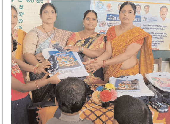
కూటమి నాయకుల హామీ

అలమూరు, పెన్ పవర్, జూలై 25: ప్రభుత్వ పాఠశాలలు ఎదుర్కొంటున్న పలు సమస్యలను విద్యా శాఖమంత్రి నారా లోకేశ్ దృష్టికి తీసుకువెళ్లి తీసుకుని వెళ్లి వాటి పరిష్కారానికి కృషి చేస్తామని కూటమి నాయకులు తెలిపారు. చింతలూరు ఎంపీపీ పాఠశాలలో గురువారం జరిగిన స్టూడెంట్ కిట్ల పంపిణీ కార్యక్రమంలో వారు పాల్గొన్నారు. గత రెండు సంవత్సరాలూ ప్రభుత్వ పాఠశాల నిర్వహణ నిధులు విడుదల కాకపోవడం వల్ల ఆ భారం ఉపాధ్యాయుల పై పడుతుందని ఈ అంశాన్ని విద్యాశాఖ