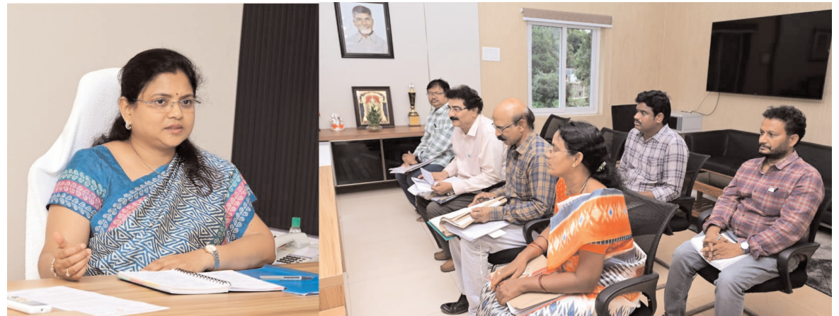
ఎస్సీ, ఎస్టీ, బీసీ, సంక్షేమ శాఖ అధికారులతో సమీక్ష

పోడూరు,, పెన్ పవర్, జూలై -25:జిల్లాలోని అన్ని సంక్షేమ వసతి గృహాల్లో విద్యార్థులకు మెరుగైన వసతి కల్పించాలని జిల్లా కలెక్టర్ చదలవాడ నాగరాణి సంబంధిత అధికారులకు ఆదేశించారు. కలెక్టర్ కార్యాలయంలో గురువారం జిల్లా కలెక్టర్ చదలవాడ నాగరాణి సంక్షేమ వసతి గృహాల అత్యవసర మరమ్మత్తులపై ఎస్సీ,