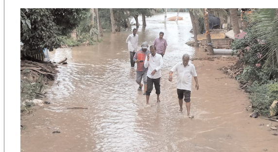
వద్దివర గ్రామంలో ప్రతి సంవత్సరం వరదల సమయంలో నష్టపోతున్న రైతాంగానికి

పోడూరు, పెన్ పవర్ జూలై- 25. గోదావరి వరద ఉధృతి పై అధికారులంతా అప్రమత్తంగా ఉండాలని నరసాపురం ఆర్డీవో ఏ. అంబారీష్ సూచించారు. పోడూరు మండలంలోని వద్దివరలో ముంపును గురువారం పరిశీలించారు. ఆవంబ వేమవరం నుండి వద్ది వరదల వల్ల పంటలు నష్టపోయిన పంటలకు మునిగిన పంటలను సంబంధిత అధికారులు అడిగి వివరాలు తెలుసుకున్నారు. రైతులు, గ్రామస్తులు నుండి గ్రామంలో ఉన్న ప్రస్తుత పరిస్థితులను అడిగి తెలుసుకున్నారు. రైతులకు అడిగిన దానికి స్పందిస్తూ కలెక్టర్ అమృత్ అంబరీష్ దృష్టికి తీసుకువెళ్లి పరిష్కారాన్ని, రైతులు ధాన్యం డబ్బులు మూడు నెలలైనా అంతవరకు రాలేదని సబ్ కలెక్టర్ అమృత్ అంబరీష్ కి అవి తొందరలో ఎవరి డబ్బులు వారికి అందుతాయని, ప్రస్తుతం వరదల దృష్ట్యా మునిగిన ప్రాంతాలలో అధికారులు నిమగ్నమై ఉన్నారు. ఇన్ ఛోజ్ గా తర్వాత