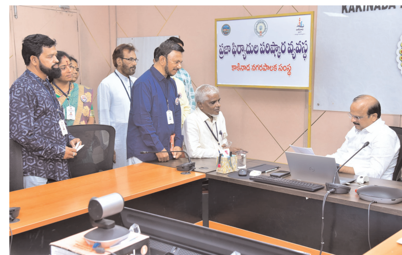
కాకినాడ, పెన్ పవర్ జూలై 15 : ప్రజా సమస్యలను సత్వరమే కార్యక్రమాన్ని కమిషనర్ కొనసాగించారు. నగరపాలక సంస్థ

అధికారులకు కమిషనర్ ఆదేశం పరిష్కరించేందుకు చర్యలు తీసుకోవాలని కాకినాడ నగరపాలక సంస్థ కమిషనర్ జే. వెంకటరావు అధికారులను ఆదేశించారు. ప్రభుత్వ ఆదేశాల మేరకు సోమవారం నగరపాలక సంస్థ కార్యాలయంలో ఉదయం 9:30 నుంచి 10:30 వరకు డయల్ యువర్ కమిషనర్ కార్యక్రమాన్ని నిర్వహించారు. ప్రజల నుంచి ఫోన్ ద్వారా వచ్చిన వినతులను కమిషనర్ స్వీకరించారు. పారిశుధ్యం, ఇంజనీరింగ్, టౌన్ ప్లానింగ్, ఉద్యాన విభాగాలకు సంబంధించి 20 మంది సమస్యలను ఫోన్ ద్వారా తెలియజేశారు. అనంతరం ప్రజా ఫిర్యాదుల పరిష్కార వ్యవస్థ