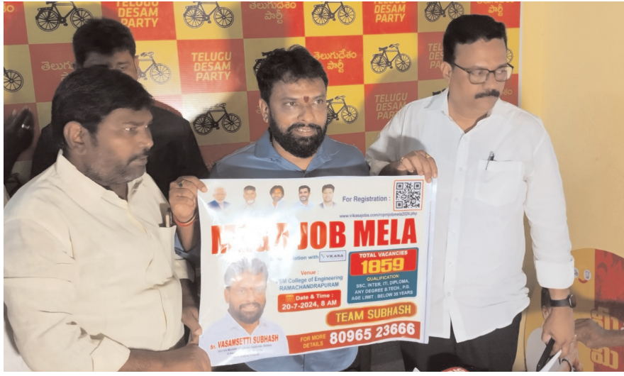
● 20న వివేకం కళాశాలలో జాబ్ మేళా ● సద్వినియోగం చేసుకోండి ● మంత్రి సుభాష్ వెల్లడి

కాజులూరు, పెన్ పవర్, జూలై 15: రాష్ట్రంలో చదువుకున్న ప్రతి విద్యార్థికి ఉద్యోగ కల్పనే ప్రధాన లక్ష్యంగా రాష్ట్ర ప్రభుత్వం పనిచేస్తుందని రాష్ట్ర కార్యకలాప మంత్రి వాసంతుల్య సుభాష్ అన్నారు. సోమవారం రామచంద్రపురం టీడీపీ పార్టీ కార్యాలయంలో మీడియా సమావేశం ఏర్పాటు చేశారు. ఈ సందర్భంగా మంత్రి సుభాష్ మాట్లాడుతూ ఈనెల 20న రామచంద్రపురం వివేకం ఇంజనీరింగ్ కళాశాలలో కాకినాడ వికాస ఆధ్వర్యంన మేగా జాబ్ మేళాను నిర్వహిస్తున్నట్లు మంత్రి తెలిపారు. ఎన్నికల సమయంలో రాష్ట్ర ముఖ్యమంత్రి నారా చంద్రబాబు నాయుడు మేనిఫెస్టోలో