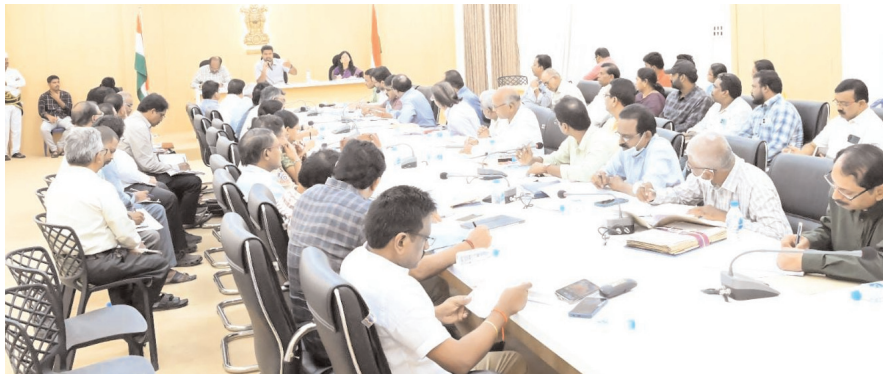
జిల్లా కలెక్టర్ ఆర్ మహేష్ కుమార్