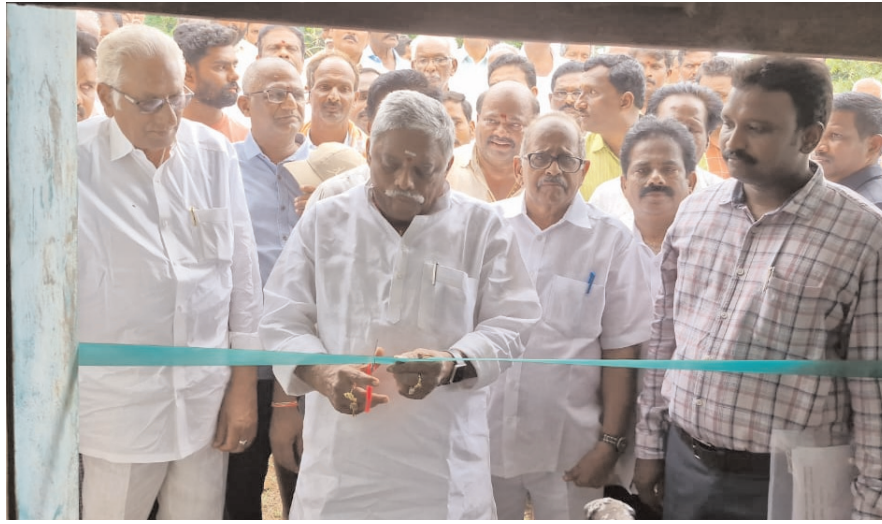
ఎత్తిపోతల పథకాన్ని పునరుద్ధరించి ప్రారంభించిన ఎమ్మెల్యే జ్యోతుల సెహ్రూ....