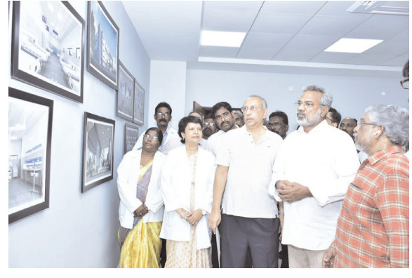
కాకినాడ, పెన్ పవర్ జూలై 10 :ఉమ్మడి ఉభయ గోదావరి జిల్లా ప్రజలకు ఆరోగ్య ప్రధానంగా బానిసభృతను కాకినాడ ప్రభుత్వ సర్జన సామాన్య ఆసుపత్రిలో పరిమితికి మించి రోగుల తాకిడి పెరుగుతున్న నేపథ్యంలో రోగులకు వైద్య సేవలు అందించడం కష్టతరంగా మారింది. 11వందల మంది రోగులకు ఇన్ పెషింట్ గా జాయిన్ చేసుకుని వారికి వైద్య సేవలు అందించేందుకు మాత్రమే సౌకర్యాల కలిగి ఉన్న ఈ ఆసుపత్రిలో ప్రస్తుతం సుమారు 18వందల నుండి 2వేల వరకు రోగులకి వైద్యులు సేవలు అందిస్తున్నారు. ఇటువంటి నేపథ్యంలో కొన్ని సమయాల్లో రోగులు అసహనానికి గురవుతున్న సందర్భాలు అనేకం ఉన్నాయి. అయితే జీజీహెచ్ కు పెరుగుతున్న ఒత్తిడికి అనుగుణంగా 500 మంది రోగులకు సరిపడేవిధంగా ఆధునిక వసతి, పడకలు, హాకీ సదుపాయాల కల్పనతో ప్రత్యేక విభాగం నిర్మించేందుకు ముందుకు వచ్చిన రాంకోనా కాకినాడ రంగరాయ మెడికల్ కాలేజీ లో డాక్టర్ పట్టా పొంది అమెరికా లో స్థిరపడిన పూర్వ విద్యార్థులు తమ స్వంత