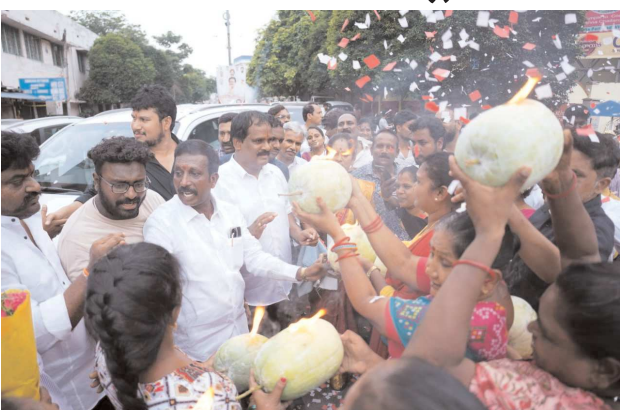
విశాఖ సీటీ, వెన్ పవర్, జూలై 08