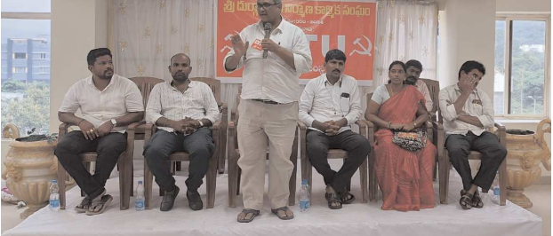
విశాఖ సీటీ, పెన్ పవర్, జూలై 08