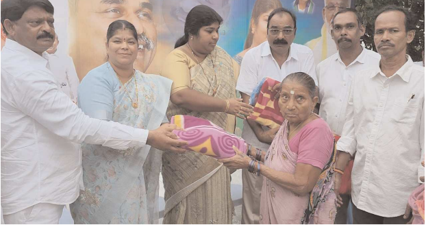
విశాఖ తూర్పు పెన్ పవర్ జూలై 8