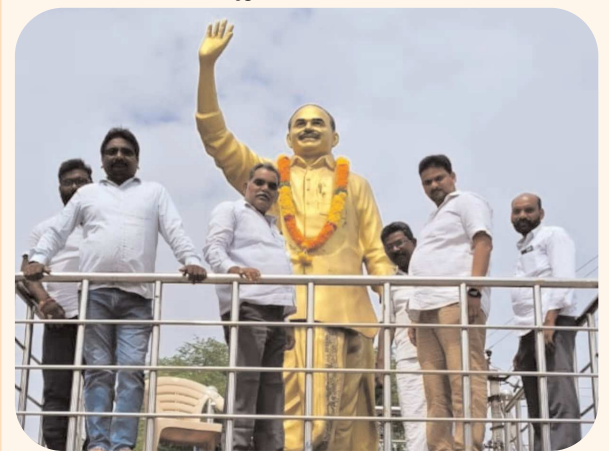
పొదిలి, వెన్ పవర్ జూలై 8