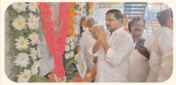
పొదిలి, వెన్ పవర్ జూలై 8