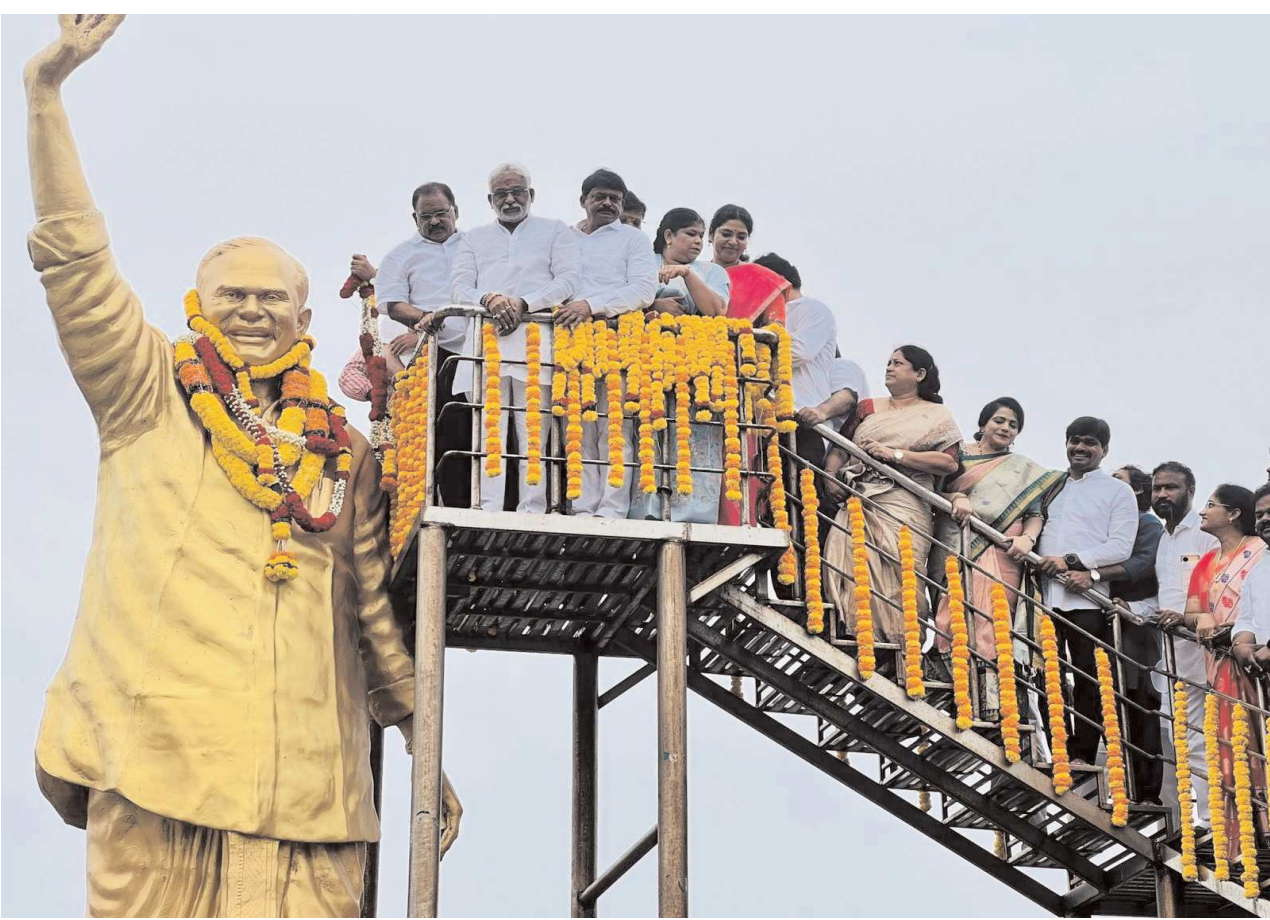
విశాఖ సీటీ, వెన్ పవర్ జూలై 8

మహోన్నత నాయకుడు వై.యస్.రాజశేఖర్ రెడ్డి రాజ్యసభ సభ్యులు వై.వి సుబ్బారెడ్డి, మాజీ మంత్రి అమర్నాథ్ తదితరులు