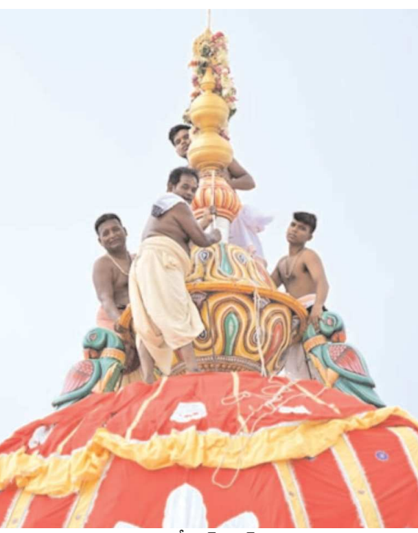
విశాఖ సిటీ పెన్ పవర్ జూలై 07

పూర్ శ్రీ జగన్నాథ స్వామి ఆలయ చరిత్ర. పూర్ శ్రీ జగన్నాథ ఆలయ చరిత్ర ఏమిటి..? పూర్ పట్టణాన్ని పూర్వం ఏమని పిలిచేవారు..?