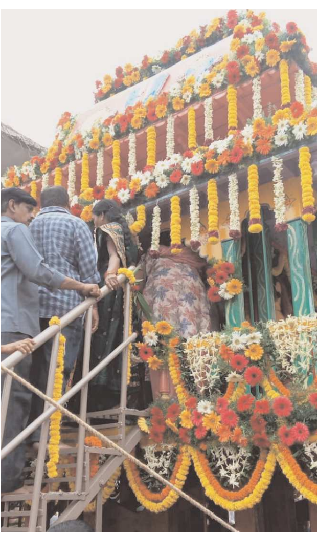
రెండు నెలలముందు నించే దీనికి సంబంధించిన ఏర్పాట్లు మొదలవుతాయి.రథం ఇలా ఉంటుందివైశాఖ బహుళ విదియనాడు రథనిర్మాణానికి కావలసిన ఏర్పాట్లు చేయమని ఆదేశిస్తారు పూర్ రాజు. అందుకు అవసరమైన వృత్తాలును 1072 ముక్కలుగా ఖండించి పూర్తికి తరలిస్తారు. ప్రధాన పూజారి, తొమ్మిది మంది ముఖ్య శిల్పిలు, వారి సహాయకులు మరో 125 మంది కలిసి అక్షయ తృతీయానాడు రథ నిర్మాణం మొదలుపెడతారు. 1072 వృక్ష భాగాలనూ నిర్మాణానికి అనువుగా 2188 ముక్కలుగా ఖండిస్తారు. వాటిలో 832 ముక్కల్ని జగన్నాథుడి రథం తయారీకి, 763కాండాలను బలరాముడి రథనిర్మాణానికి, 593 భాగాలను సుభద్రాదేవి రథానికి వినియోగిస్తారు. అషాఢ శుద్ధ పాడ్యమినాటికి రథనిర్మాణాలు పూర్తయి యాత్రకు సిద్ధమవుతాయి. ఇందులో జగన్నాథుడి రథాన్ని నందిఘోష అంటారు. 45 అడుగుల ఎత్తున ఈ రథం వదహార చక్రాలతో మిగతా రథం కన్నా పెద్దదిగా ఉంటుంది. ఎర్రటిచారలున్న పసుపుపసుపుతో 'సందిఘోష' 'ను అలంకరిస్తారు. బలభద్రుడి రథాన్ని తాళభ్యజం అంటారు. దీని ఎత్తు 44 అడుగు లు. వద్దాలుగు చక్రాలంటాయి. ఎర్రటి చారలున్న నీలివస్త్రంతో ఈ రథాన్ని కప్పతారు. సుభద్రాదేవి రథం " పద్మభ్యజం " . దీని ఎత్తు 43 అడుగులు. పన్నెండు చక్రాలంటాయి. ఎర్రటి చారలున్న నలుపు పసుపుతో పద్మభ్యజాన్ని అలంకరిస్తారు. ప్రతిరథానికి 250 అడుగుల పొడవూ ఎనిమిది అంగుళాల మందం ఉండే తాళ్ళను కడతారు. ఆలయ తూర్పుభాగంలో ఉండే సింహద్వారానికి ఎదురుగా ఉత్తరముఖంగా ఈ మూడు రథాలని నిలబెడతారు.అంతా ఒక పద్మత్ర ప్రకారం.

రథయాత్ర మొదటి రోజున మేళతాళాలతో గర్భగుడిలోకి వెళ్ళే పందాలు అని పిలవబడే ఇక్కడి పూజరులు ఉదయకాల పూజాదికాలు నిర్వహిస్తారు. శుభముహూర్తం ఆసన్నమౌ పూజనే 'మనిమా (జగన్నాథా) ' అని పెద్దపెట్టున అరుస్తూ రత్నపీఠం మీద నుంచి విగ్రహాలను కదిలిస్తారు. ఆలయ ప్రాంగణంలోని ఆనంద బజారు, అరుణస్రంభం మీదుగా వాటిని పూరేశ్వరులు బయటికి తీసుకువస్తారు. ఈ క్రమంలో పురుషాంతలో లక్షలాది మంది భక్తులు పాల్గొంటారు.. 12 రోజుల పాటు జరిగే ఉత్సవం సారాంశంగా ఏ హిందూ ఆలయంలోనైనా సరే, ఊరేగింపు నిమిత్తం మూలవిరాట్టును కదిలించరు. అందుకు ఉత్సవ విగ్రహాలుంటాయి. అలాగే ఊరేగింపు సేవలో ఏటా ఒకే రథాన్ని వినియోగించడం అన్ని చోట్లా చూసేదే. ఈ సంప్రదాయాలన్నింటికి మినహాయింపు ఒడిశాలోని ఈ పూర్ జగన్నాథ స్వామి ఆలయం. బలభద్ర, సుభద్రలతో సహా ఈ ఆలయంలో కొలువైన జగన్నాథుడిని ఏడాదికొకసారి గుడిలోంచి బయటికి తీసుకువచ్చి భక్తులకు కనవిందు చేస్తారు. ఊరేగింపుకు ఏటా కొత్తరథాలను నిర్మిస్తారు. అందుకే ఈ జగన్నాథ రథయాత్రను అత్యంత అపురూపంగా భావిస్తారు భక్తులు.