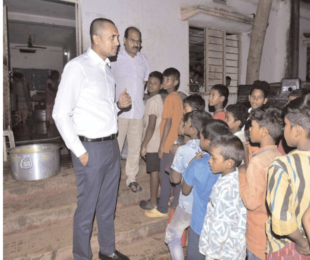
పార్వతీపురం పెన్ పవర్ జూలై 7

వసతి గృహాల్లో చిన్నారులకు నాణ్యమైన ఆహారం అందించాలని జిల్లా కలెక్టర్ ఎ. శ్యామ్ ప్రసాద్ అధికారులను ఆదేశించారు. ఆదివారం స్థానిక సాయ నగర్ కాలనీ లోని ఏకలవ్య మోడల్ రిసిడెన్స్ సూల్లో, గిరిజన సంక్షేమ ఆశ్రమ పాఠశాల వసతి గృహాల్లో ఆకస్మిక తనిఖీ నిర్వహించారు. జిల్లా కలెక్టర్ గా విధుల్లో చేరిన రోజే ఆశ్రమ పాఠశాల నిర్వహణపై దృష్టి సారించారు. విద్యార్థులకు వండిన వంటకాలను రుచి చూశారు. మెనూ ప్రకారం విద్యార్థులకు ఆహారం అందుతున్నది లేనిది ఆరా తీశారు. వంటకాలలో రాజీ పడకుండా విద్యార్థులకు నాణ్యమైన పోషకాహారం అందించాల్సిందేనని అన్నారు. వసతి గృహాల బయట అపరిశుభ్రంగా ఉన్న పరిసరాలను పరిశీలించి అందుగల కారణాలను అడిగి తెలుసుకున్నారు. పరిసరాలను పరిశుభ్రంగా ఉంచాలని అవసరమైన డస్ట్ బిన్ లను ఏర్పాటు చేయాలని సూచించారు. విద్యార్థుల స్టడీ హావర్ ల నిర్వహణను, తరగతుల; బోధన విషయాలను ప్రధానోపాధ్యాయులను అడిగారు. విద్యార్థుల పడకకు దుప్పట్లు ఉన్నవి లేనివి