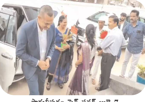
పార్వతీపురం పెన్ పవర్ జూలై 7

మణ్య ప్రక్షాళన దిశగా "స్వామ్ ప్రసాద్" నేటి సుంచి మరలా పార్వతీపురం బటిడీపీ పీఓ గ్రీవెన్స్ బటిడీపీ ఖజానా ఖాళీ చేసిన "అవినీతి కూర్మనాథ్" బటిడీపీ నిధులు మల్లంపులో పలు ఆరోపణలు మణ్య సోషల్ మీడియాలో "ప్రతి సోమవారం బటిడీపీ గ్రీవెన్స్" ఆదివారం తెగ చక్కర్లు -సంతోషం వ్యక్తం చేస్తున్న గిరి ప్రజా