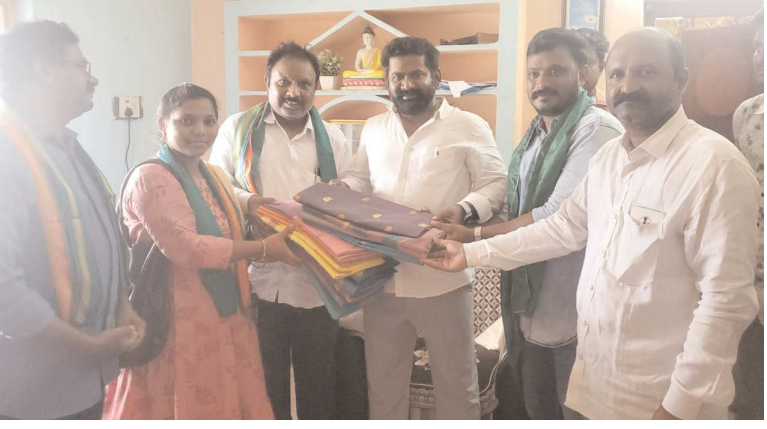
పార్వతీపురం పెన్ పవర్ జూలై 7

చరిత్రలో చెరువులపై ఎమ్మెల్యే సేవలు పదిలం చెరువుల్లో ఆక్రమణలు తొలగించేందుకు ఎమ్మెల్యే చేసిన సేవలు దేశమంతటికి చాటి చెబుతాం పార్వతీపురం ఎమ్మెల్యేను అభినందించిన ఉత్తరాంధ్ర చెరువుల పరిరక్షణ సమితి వ్యవస్థాపక, రాష్ట్ర అధ్యక్షులు