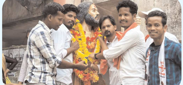
గూడెం కొత్త వీధి, పెన్ పవర్, జూలై 4