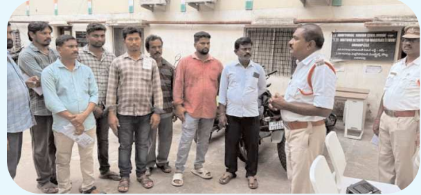
అనకాపల్లి, పెన్ పవర్, జూలై 4