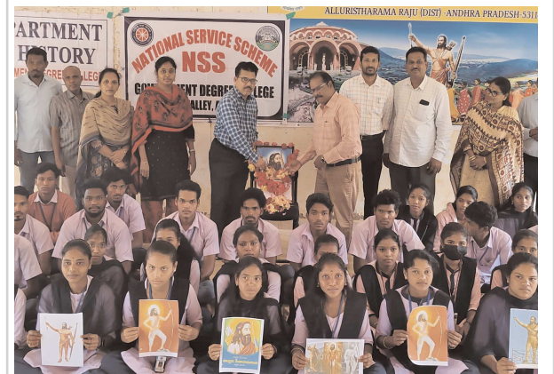
అరకులో, పెన్ పవర్ జూలై 4