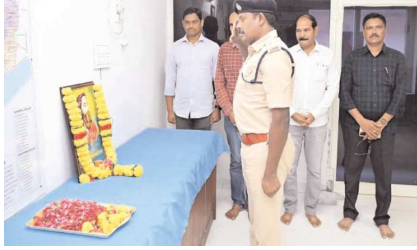
అనకాపల్లి, పెన్ పవర్, జూలై 4