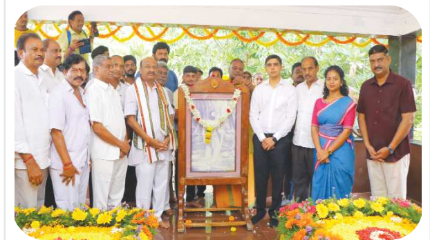
సభ్యపట్టుం, పెన్ పవర్ (జూలై 04)