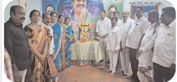
విశాఖ సీటీ, పెన్ పవర్, జూలై 04