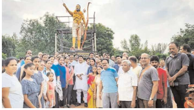
ఎన్ఎస్సీ, పెన్ పవర్, జూలై 4