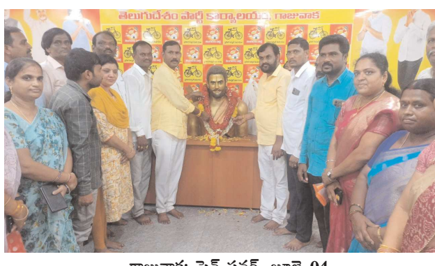
గాజువాక: పెన్ పవర్, జూలై 04