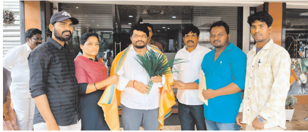
పార్లమెంట్ అధ్యక్షుడు కిరారి శ్రావణ్ కుమార్, రేషన్ డీలర్ల సమస్యలను తప్పకుండా ముఖ్యమంత్రి దృష్టికి తీసుకు వెళ్లి మీకు న్యాయం జరిగేలా చూస్తానని సనుకూలంగా స్పందించి హామీ ఇచ్చినట్లు వారు స్పష్టం చేశారు.

అరకులో పెన్ పవర్ 4 ఏజెన్సీలో రేషన్ డీలర్ల సమస్యలు పరిష్కరించాలని గిరిజన రేషన్ డీలర్ల సంక్షేమ సంఘం నాయకులు అరకు పార్లమెంట్ ఇంఛార్జి శ్రావణ్ కుమార్ కు గురువారం వినతి పత్రం అందజేశారు. ఆయన క్యాంపు కార్యాలయంలో మర్యాద పూర్వకంగా కలిసి పుష్ప గుచ్ఛం అందించి శాలువాతో సన్మానం చేశారు. రేషన్ డీలర్లు గత కొన్నేళ్లుగా కేవలం ప్రభుత్వం ఇచ్చే కమిషన్ తోనే కొనసాగిస్తున్నారని, వచ్చే కమిషన్ కూడా సరిపోవడం లేదని వారు వివరించారు. గిరిజన సహకార సంస్థలో చాలా ఉద్యోగాలు ఖాళీగా ఉన్నాయని, జీసీసీలో ఖాళీలను తమకు కేటాయించి గిరిజన సహకార సంస్థలో విలీనం చేసి గౌరవ వేతనం, ఉద్యోగ భద్రత కల్పించేలా చూడాలని మాజీ మంత్రి కిరారి శ్రావణ్ కుమార్ ను కోరారు. సనుకూలంగా స్పందించిన అరకు