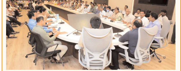
విశాఖ సీట్, పెన్ పవర్, జూలై 04