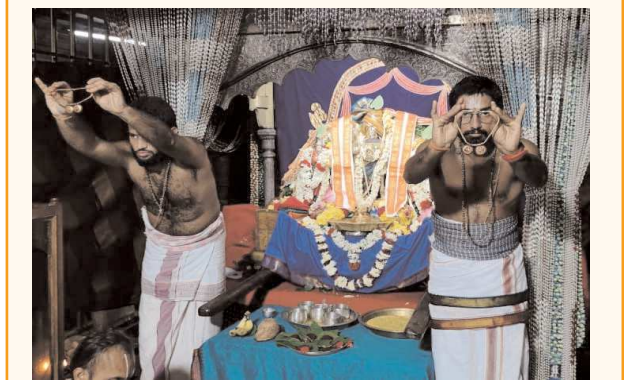
సింహాచలం, పెన్ పవర్, జూలై 4

శ్రీ వరాహలక్ష్మీనృసింహ స్వామి నిత్య కళ్యాణం నేతృవర్గంగా సాగింది. ఆర్థిక సేవల్లో భాగంగా ఉత్సవమూర్తి గోవిందరాజస్వామిని ఉభయ దేవతలతో మండ పంరో అధిష్టించజేశారు. పాల్గొన్న భక్తుల, గోత్రనామా లతో సంకల్పం చెప్పి పాంచరాత్రాగమశాస్త్రం విధానంలో విశ్వక్సేనారాధన, పుణ్యాహారాలతో కార్యక్రమానికి శ్రీకారం చుట్టారు. కంకణధారణ, నూతన యజ్ఞోపవీత సమర్పణ, జీలకర్ర, బెల్లం, మాంగళ్య ధారణ, తలంబ్రాల ప్రక్రియలను కమనీయంగా జరిపించారు. మంత్రపుష్పం, మంగళాశాసనాల తర్వాత భక్తులకు వేదాశీర్వచనాలు, శేషవస్త్రాలు, స్వామివారి ప్రసాదాలను అందజేశారు.