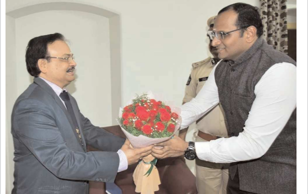
విశాఖ సి.టి, పెన్ పవర్, జూలై 13