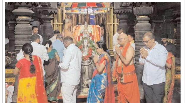
సింహాచలం, పెన్ పవర్, జూలై 13

శ్రీ వరహా లక్ష్మీ నరసింహస్వామి దేవస్థానం, సింహాచలంలో శ్రీ స్వామివారి గరుడ సేవ సేత్రవర్యంగా సాగింది. ఆర్థిత సేవల్లో భాగంగా ఉత్సవమూర్తి గోవిందరాజస్వామిని మండవంలో అధిష్టించజేశారు. పాల్గొన్న భక్తుల, గోత్రనామా లతో సంకల్పం చెప్పి పాంచరాత్రగంపూజాప్రసాదం విధానంలో కార్యక్రమానికి కమనీయంగా జరిపించారు. మంత్రపఠనం, మంగళాశాసనాల తర్వాత భక్తులకు వేదాశీర్వాచనాలు, శేషవస్త్రాలు, స్వామివారి ప్రసాదాలను అందజేశారు.