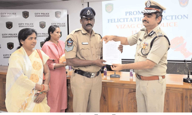
విశాఖ సి.టి, పెన్ పవర్, జూలై 13