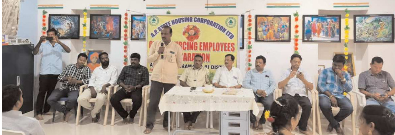
కొయ్యూరు, పెన్ పవర్ జూలై 13

గృహనిర్మాణశాఖ కాంట్రాక్ట్ ఉద్యోగులు ప్రభుత్వానికి విజ్ఞప్తి