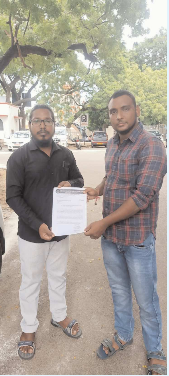
స్టాఫ్ రిపోర్టర్, పెన్ పవర్, ఒంగోలు, జూలై 13