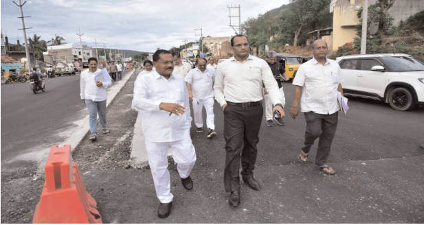
విశాఖ సి.టి, పెన్ పవర్ జూలై 13