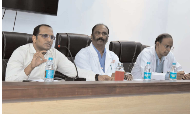
విభాగ సీటి, పెన్ పవర్, జూలై 13

సి.టి.ఎం.ఆర్.ఐ. స్కానింగ్ సెంటర్ల పరిశీలన, సేవలపై ఆరా