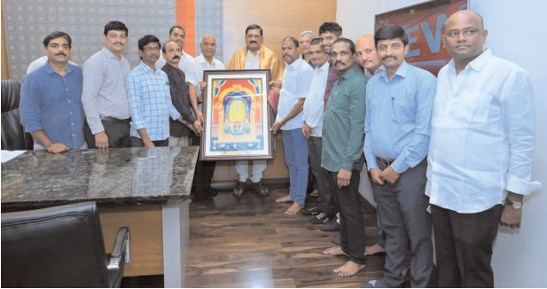
విశాఖపట్నం, పెన్ పవర్, జూలై 13