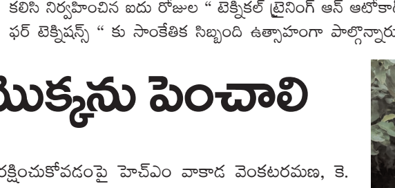
గండేపల్లి, పెన్ పవర్, జూలై 27 : సూరంపాలెం ఆదిత్య కాలేజ్ ఆఫ్ ఇంజనీరింగ్ అండ్ టెక్నాలజీ నందు సివిల్ ఇంజనీరింగ్ విభాగంలో నిర్వహించిన ఐదు రోజుల నైపుణ్యాభివృద్ధి సదస్సు శనివారంతో ముగిసింది. ఇండియన్ కాంక్రీట్ ఇన్స్టిట్యూట్ తో కలిసి నిర్వహించిన ఐదు రోజుల “ టెక్నికల్ ట్రైనింగ్ ఆన్ ఆటోకాడ్ ఫర్ టెక్నిషియన్స్ “ కు సాంకేతిక సిబ్బంది ఉత్సాహంగా పాల్గొన్నారు.