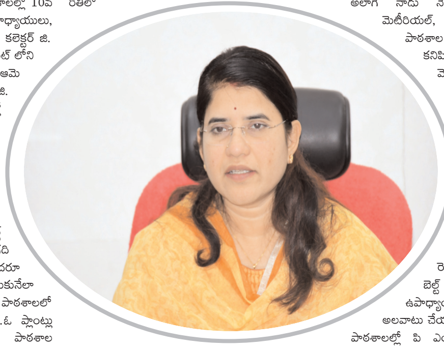
టాయిలెట్ వినియోగం గురించి అవగాహన కలిగిస్తూ పాఠశాలల్లో స్వచ్ఛతకు అధిక ప్రాధాన్యత ఇవ్వాలని కలెక్టర్ ఆదేశించారు.