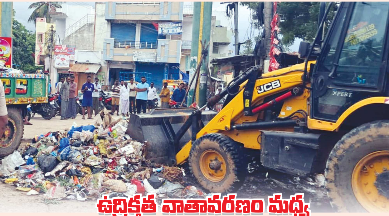
ఉద్దిక్షిత వాతావరణం మధ్య