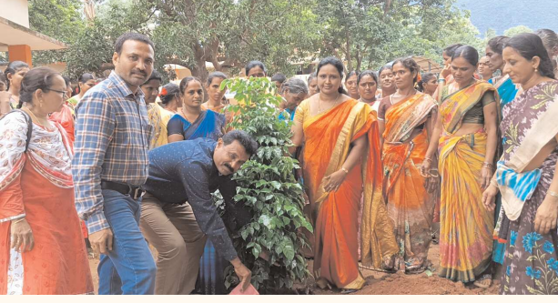
నాకవరం పెన్ పవర్ (జూలై 27)