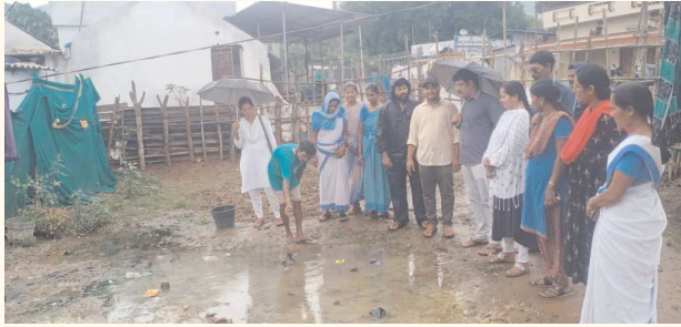
కొయ్యూరు, పెన్ పవర్ జూలై 25

గ్రామాల్లో పనులను పరిశీలించిన ఎంపీడీఓ సీతయ్య.