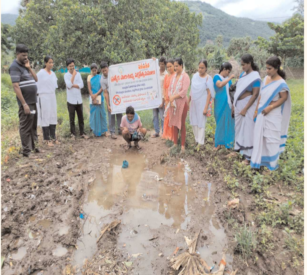
కొయ్యూరు పెన్ పవర్ జూలై 27:

జిల్లా కలెక్టర్, డిపిఓ, డిఎల్ పి ఓ ఆదేశాలతో పనులు ముమ్మరం