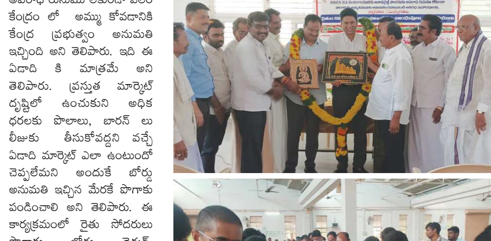
కందుకూరు పెన్ పవర్, జూలై 26