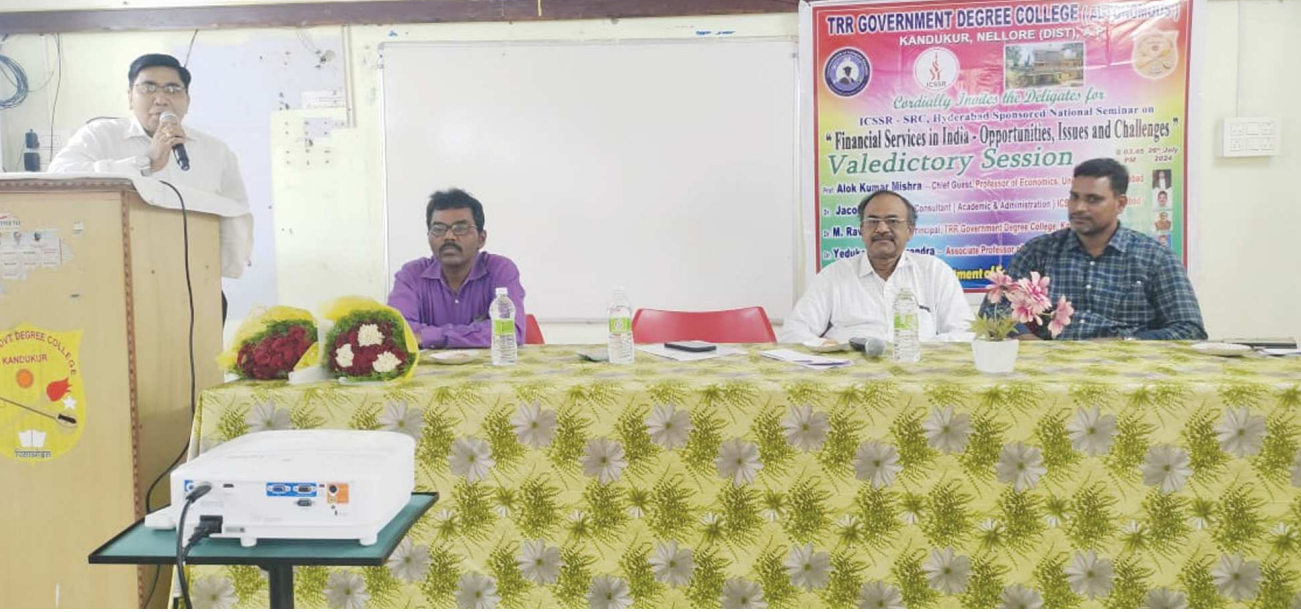
కందుకూరు పెన్ పవర్ జూలై 26