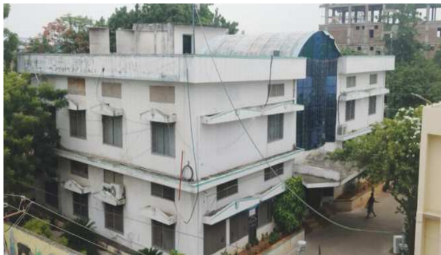
కాజేస్తున్నట్లు సర్దుత ఆరోపణ వినిపిస్తున్నాయి. శివారు కాలనీలకు

అత్యధిక జనాభా కలిగిన మున్సిపాలిటీలో చిలకలూరిపేట మున్సిపాలిటీ ఒకటి. మున్సిపాలిటీకి సంబంధించి అన్ని బాధ్యతల్లో ప్రజలకు తాగునీరు అందించడం ప్రధానమైంది. కేవలం మున్సిపాలిటీ సరఫరా చేసే నీటిపైనే చాలా మంది ఆధారపడి ఉన్నారు. అన్ని అవసరాలకోసం మునిసిపల్ నీటిని వినియోగిస్తారు. తాగునీటి చెరువుల నిండా నీరు ఉన్నా ఆ నీరు సక్రమంగా పంపిణీ చేయలేని పక్షంలో ఇబ్బంది తప్పదు. లీకుల మరమ్మత్తులు, ఇతర సమస్యలను సరిదిద్ది సక్రమంగా కుళాయిల ద్వారా ఇంటింటికి అన్ని ప్రాంతాల ప్రజలకు తాగునీరు అందించాల్సి ఉంటుంది. అయితే చిలకలూరిపేట మున్సిపాలిటీలో అలా జరుగుతుందా...? అంటే లేదనే సమాధానం వస్తుంది. నీటి సరఫరాలో తీవ్ర గందరగోళం నెలకొనే ఉంటుంది. ఎక్కడ చూసినా పైప్ లైన్ లో లీకులు... లీకుల వల్ల కలుషిత నీరు కుళాయిలలో కలిసి చిలకలూరిపేటలో వ్యాధులు ప్రభలే అవకాశం ఎక్కువగా ఉంది. కొంతమంది లైన్ మెన్లు, నీటి సరఫరా పర్యవేక్షణ అధికారికి ఈ పైప్ లైన్ లీకుల వల్ల జేబులు నింపుతాయి. ఈ పైప్ లైన్లు లీకులు చేయించడానికి సంబంధిత అధికారి తన కుటుంబ సభ్యుల్ని బంధువులను పెట్టుకొని లీకులు మమ అనిపించి నెలకు లక్షల్లో బిల్లులు