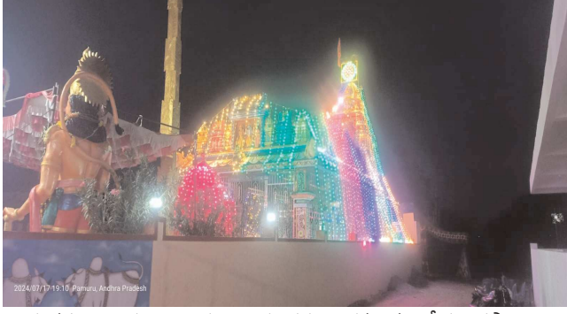
పెన్ పవర్ పామూరు జూలై 17

పట్టణంలో అంకాలమ్మ వీధి నందు బుధవారం ఐదు రోజులపాటు అంగరంగ వైభవంగా జరిగిన శ్రీశ్రీశ్రీ సీతారామచంద్ర స్వామి వారి తిరునాళ్ళ మహోత్సవం దేవస్థానం కమిటీ ఆధ్వర్యంలో జరిగినది. సీతారామచంద్ర స్వామి వారి కళ్యాణ మహోత్సవం నిర్వహించారు. అనంతరం స్వామివారి మేళ తాళాలతో స్వామి వారి గ్రామోత్సవం