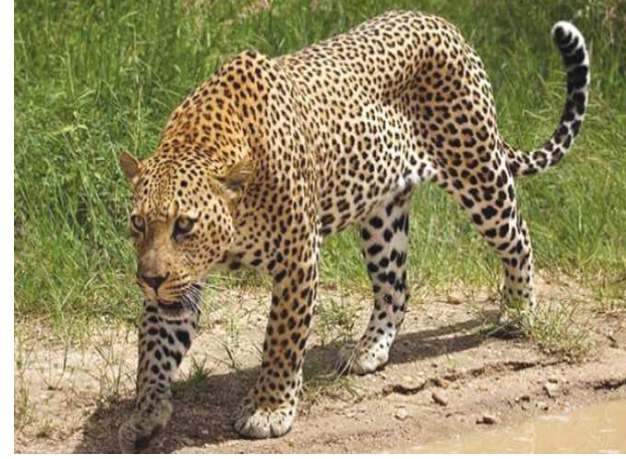
రాచర్ల ఫారం గ్రామ పొలాల్లో