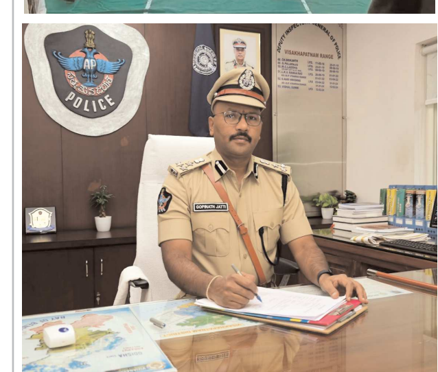
విశాఖ సీ.ఐ. పెన్ పవర్, జూలై 17