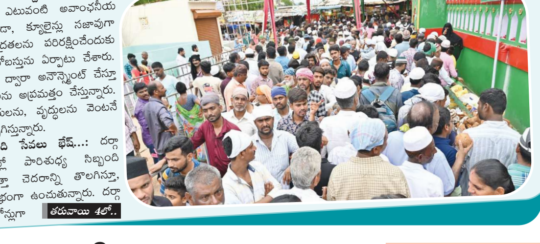
పటిష్ట బందోబస్తు... దర్గా ప్రాంగణంలో ఎటువంటి అవాంఛనీయ ఘటనలు జరగకుండా, క్యూలైన్లు సజావుగా సాగేలా, శాంతి భద్రతలను పరిరక్షించేందుకు పటిష్ట పోలీసు బందోబస్తును ఏర్పాటు చేశారు. పోలీస్ అవుట్ పోస్ట్ ద్వారా అసెస్మెంట్ చేస్తూ ఎప్పటికప్పుడు భక్తులను అప్రమత్తం చేస్తున్నారు. తప్పిపోయిన చిన్నారలను, వృద్ధులను వెంటనే సంబంధితలకు అప్పగిస్తున్నారు.