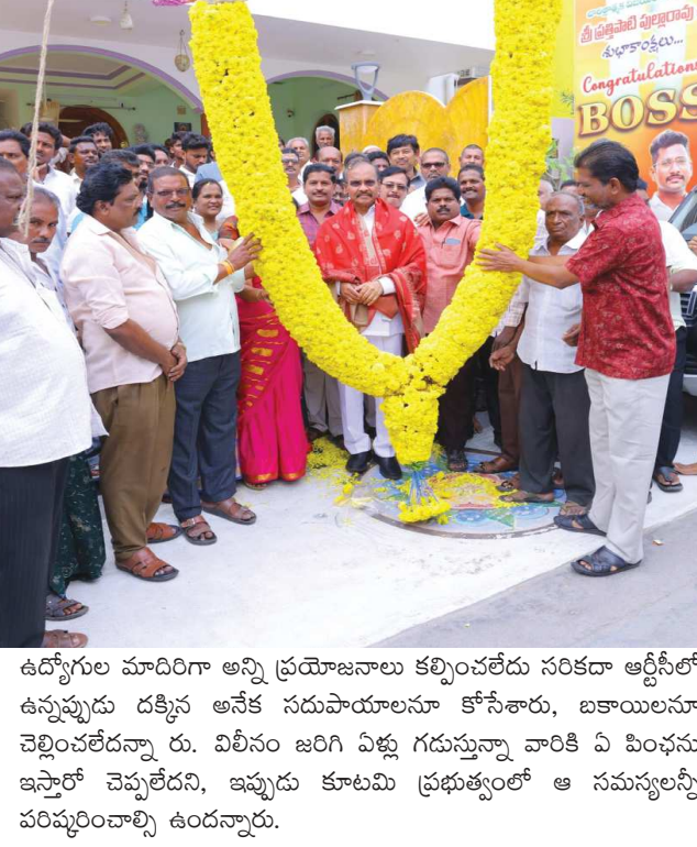
ఉద్యోగుల మాదిరిగా అన్ని ప్రయోజనాలు కల్పించలేదు సరికదా ఆర్టీసీలో ఉన్నప్పుడు దక్కిన అనేక సదుపాయాలనూ కోసేశారు, బకాయిలనూ చెల్లించలేదన్నారు. విలీనం జరిగి ఏళ్లు గడుస్తున్నా వారికి ఏ ఏంధను ఇస్తారో చెప్పలేదని, ఇప్పుడు కూటమి ప్రభుత్వంలో ఆ సమస్యల్ని పరిష్కరించాల్సి ఉందన్నారు.

చిలకలూరిపేట పెన్ పవర్ ప్రతినిధి జూలై 17: రాష్ట్రంలో ఆర్టీసీ కార్మికులను మాజీ ముఖ్యమంత్రి జగన్ రెడ్డి స్థాయిలో నమ్మించి మోసం చేసిన వ్యక్తి మరొకరు లేరని ఆగ్రహం వ్యక్తం చేశారు మాజీమంత్రి, తెలుగుదేశం పార్టీ సీనియర్ ఎమ్మెల్యే ప్రతిపాటి పుల్లారావు. అంతకు ముందు వరకు ప్రగతిరథ చక్రాలుగా ఉన్న ఆర్టీసీ జగన్ రెడ్డితో కోడ్డున పడే దుస్థితి దాపురించిందని, కార్మికుల సంక్షేమాన్ని పూర్తి విస్మరించారన్నారు. విలీనం పేరిట కూడా ఆర్టీసీ కార్మికుల ప్రయోజనాలను కాలరాసి వారు కోలుకోలేని విధంగా దెబ్బ తీసిన దుర్మార్గుడు జగన్ అని మండిపడ్డారు. చిలకలూరిపేట ఆర్టీసీ డిపో ఉద్యోగ సంఘాలు బుధవారం ప్రతిపాటి పుల్లారావును ఘనంగా సవాసించారు. ఉద్యోగుల సమస్యలు తెలుసుకొని వాటి పరిష్కారానికి సత్వరమే స్పందించారని ఆయనకు వారంతా కృతజ్ఞతలు తెలిపారు. భారీ గజమాలతో పాటు శాలువతో ప్రతిపాటిని సత్కరించారు. ఈ సందర్భంగా మాట్లాడిన ప్రతిపాటి ఆర్టీసీకి నూతన జనసత్కాలు కల్పించడంలో తెలుగుదేశం పార్టీ కూటమి ప్రభుత్వం పూర్తి చిత్రశుద్ధితో ఉండవచ్చు. కొత్తబస్సులు, సర్వీసుల పెంపు, కార్మికుల ప్రయోజనాల పరిరక్షణ కోసం ముఖ్యమంత్రి చంద్రబాబు స్పష్టమైన ప్రణాళికలతో ఉన్నారని తెలిపారు. మహిళలకు ఉచిత బస్సు ప్రయాణంతో ఆర్టీసీకి మరొక ఆదరణ, ఆదాయం రెండు పెరుగుతాయన్నారు. 2019 ఎన్నికల్లో ఆర్టీసీని ప్రభుత్వంలో విలీనం చేస్తానని హామీ ఇచ్చిన జగన్ పేరుకి చేసినా ప్రభుత్వ