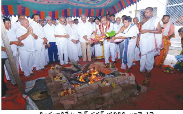
చిలకలూరిపేట పెన్ పవర్ ప్రతినిధి జూలై 17:

ఏకాదశి సందర్భంగా కోటప్పకొండ త్రికోటేశ్వరస్వామికి ప్రతిపాటి పూజలు: ప్రతిపాటి