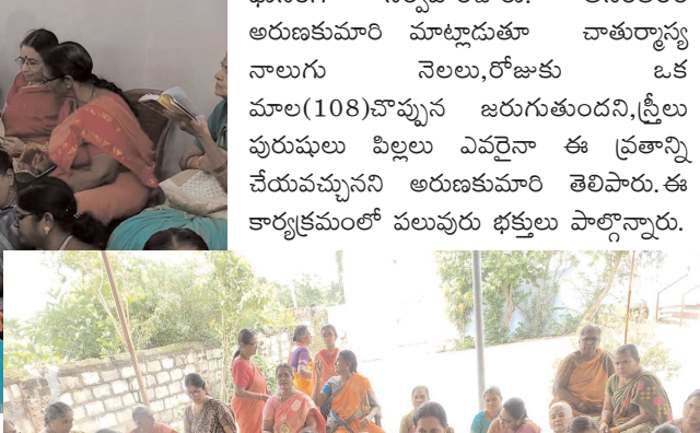
భట్టిప్రోలు, పెన్ పవర్ జూలై 16: