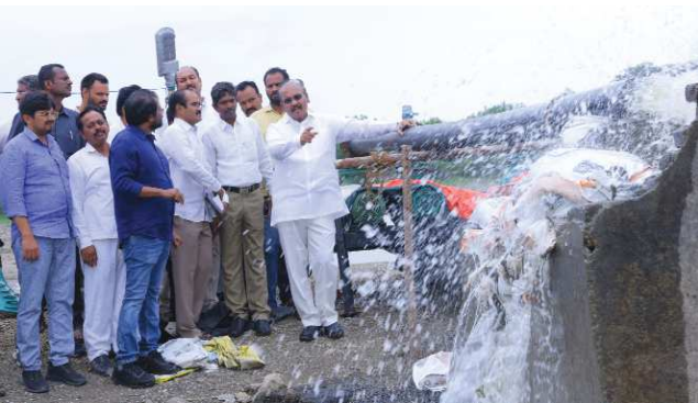
చిలకలూరిపేట పెన్ పవర్ ప్రతినిధి జూలై 17