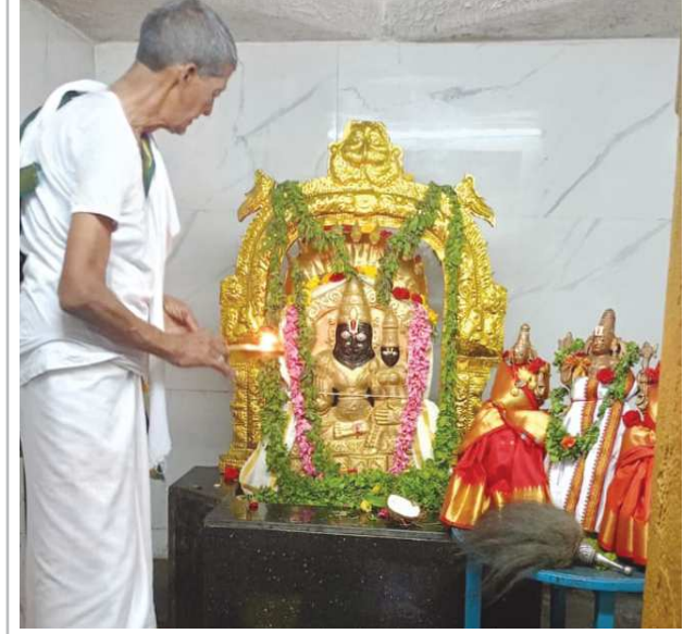
పెద్ద దోర్నాల పెన్ పవర్ జూలై 17

పట్టణంలోని మరియు మండలంలోని అన్ని దేవాలయంలో తొలి ఏకాదశి వేడుకలు బుధవారం ఘనంగా నిర్వహించారు ఈ సందర్భంగా ఆర్కులు మాట్లాడుతూ హిందువుల తొలి పండుగగా ఖ్యాతించెందిన తొలి ఏకాదశి పండుగకు ప్రత్యేక స్థానమున్నది. సంవత్సరంలో వచ్చే 24 ఏకాదశులలో అషాడ శుద్ధ ఏకాదశినాటి నుండి శ్రీ మహా విష్ణువు నాలుగు నెలలపాటు క్షీర సాగరంలో శేషశత్రుంపై శయనిస్తాడు. ఈ రోజున ఉపవాసం వుండి, జాగరణ చేసి, శ్రీ మహా విష్ణువును పూజించినచో విశేష ఫలితాలు మనకు కలుగుతాయని పురాణాలు తెలియజేస్తున్నాయి. తొలి ఏకాదశి రోజున ఉపవాసం వుండి, జాగరణ చేసి, శ్రీ మహా విష్ణువును పూజించి నిర్వహించారు. అన్నార అనంతరం పట్టణంలోని శ్రీ లక్ష్మీ నరసింహ స్వామి ఆలయంలో ప్రత్యేక పూజలు నిర్వహించారు . ఈ కార్యక్రమంలో గ్రామ ప్రజలు భక్తులు మహిళలు తదితరులు పాల్గొన్నారు.