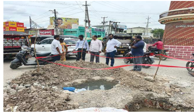
ట్యాప్ ఇన్స్టాల్లర్ కు గత పాలకుల అండ దండలు మేండు...

కుళాయిల ద్వారా నీరు అందవు. సరఫరా అయ్యే నీరు ఎంతసేపు, ఎప్పుడు విడదల చేస్తారో, లీకుల వల్ల ఏ అంటూ వ్యాధులు ప్రబలుతాయో తెలియదు. అర్హతలేని ఉద్యోగి.. ఒకే ప్రాంతంలో పాతుకు పోయిన సిబ్బంది... నీటి సరఫరా విభాగంలో పనిచేసే ట్యాప్ ఇన్స్టాల్లర్లు ఏళ్ల తరబడి ఎటువంటి అరతలు లేకుండా అతన్నే కొనసాగిస్తున్నారు. గతంలో లీకులు సరిచేసే విభాగంలో పనిచేసిన ఇతను తన పలుకుబడిని ఉపయోగించుకొని ముఖ్య అధికారి వద్దవిని చేజిక్కించుకున్నాడు. దశాబ్దం పైగా ట్యాప్ ఇన్స్టాల్లర్ ఇన్చార్జిగా వ్యవహరిస్తున్నాడు. ఏ ప్రభుత్వం మారినా కీలకమైన ఈ స్థానాన్ని భర్తీ చేయకపోవడం విశేషం. మరోవైపు ట్యాప్ లైన్ మెన్లుగా వ్యవహరించే వారిని సైతం దశాబ్దాలుగా పనిచేసే ప్రదేశం నుంచి స్థానచలం లేకపోవడం కూడా వారిలో అంతలేని నిర్లక్ష్యుడి, అవినీతికి కారణమవుతుంది. వేదా లీకుల్ని వినియోగించే అపారైమెంట్లు, రెస్టారెంట్లు, హోటళ్లకు మీటర్లు పనిచేయవు. వీరు నిర్ధారించిన నామ మాత్రపు ఫీజు మాత్రమే మున్సిపాలిటీకి జమవు అవుతాయి. మిగిలిన సగదు వీరి జేబుల్లోకి చేరుతుంటాయి.