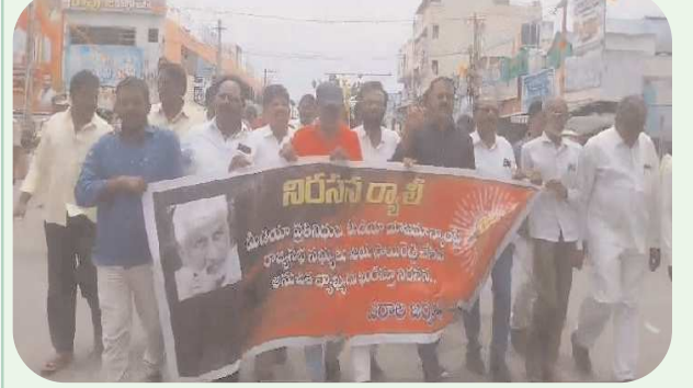
చీరాల, జూలై 17, పెన్ పవర్

మీడియా ప్రతినిధులను చులకనగా మాట్లాడిన వైసీపీ ఎంపీ విజయసాయిరెడ్డి వైఖరిని నిరసిస్తూ, చీరాలలో జర్నలిస్టులు నిరసన ర్యాలీ నిర్వహించారు. తక్షణమే అనుచిత వ్యాఖ్యలు చేసిన ఎంపీ విజయసాయిరెడ్డి, బహారంగ క్రమపథం చెప్పాలని డిమాండ్ చేశారు. గౌరవ హో దాల్ ఉంది, ప్రజాస్వామ్యంలో ఫోర్ట్ ఎస్టేబ్లీ అయిన మీడియా ను, కింపవరిచేలా మాట్లాడిన విజయసాయిరెడ్డి రాజ్యసభ సభ్యత్వాన్ని, రద్దు చేయాలని డిమాండ్ చేశారు. జర్నలిస్టు లపై జరుగుతున్న దాడులను ఖండించారు. విజయసాయి రెడ్డికి వ్యతిరేకంగా నివాదాలు చేస్తూ, జర్నలిస్టుల ఐక్యత వర్ధిల్లాలి అంటూ, పురవీధుల్లో ర్యాలీ నిర్వహించారు. ర్యాలీ గా తహసిల్దార్ కార్యాలయం కు చేరుకుని, ధర్నా చేసి నిరసన తెలిపిన అనంతరం, వైసీపీ ఎంపీ విజయ సాయిరెడ్డి పై తగిన చర్యలు తీసుకునేలా, ప్రభుత్వానికి తెలియజేయాలని వినతిపత్రం అందజేశారు.కార్య క్రమంలో చీరాల జర్నలిస్టులు, మద్దతుగా టిడిపి, జనసేన, బి జెపి, ఆయా పార్టీలు, ప్రజా సంఘాల, సంస్థల నాయకులు పాల్గొన్నారు.