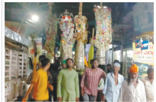
గిద్దలూరు పెన్ పవర్ జూలై 15

మొహరం వేడుకల్లో భాగంగా సోమవారం నాడు గిద్దలూరు లోని రెండు పీర్ల చావిళ్ల లో పగలు సరిగేసును నిర్వహించు వైభవంగా నిర్వహించారు ఖారర్ వల్లి స్వామి 'మహబూబ్ సుభాని స్వామి వార్ష పేర్ల తో పాటు ఇతర స్వామిల పీర్లను సన్మానించుతూ అలంకరించి గ్రామోత్సవం నిర్వహించారు భక్తులు కొబ్బరి కాయలు చక్కెర ను చదివింపులు చేసి మొక్కులు చెల్లించుకున్నారు ఈ సందర్భంగా ఉత్సవంలో తప్పిల్ల మోతలు మోగాయి.