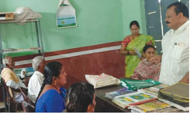
కొమరోలు పెన్ పవర్ జూలై 15