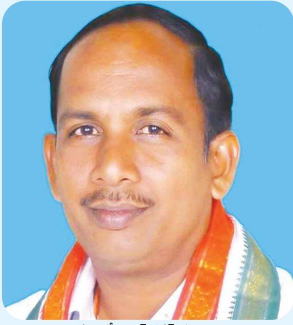
చిలకలూరిపేట పెన్ పవర్ ప్రతినిధి జూలై 15