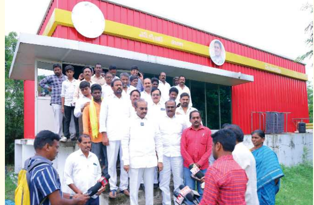
చిలకలూరిపేట పెన్ పవర్ ప్రతినిధి జూలై 15

ఎన్టీఆర్ సుజల పథకం, పాతచెరువు, కొత్తచెరువు పరిశీలించిన ప్రతిపాటి