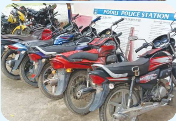
పొదిలి, పెన్ పవర్ జూలై 15