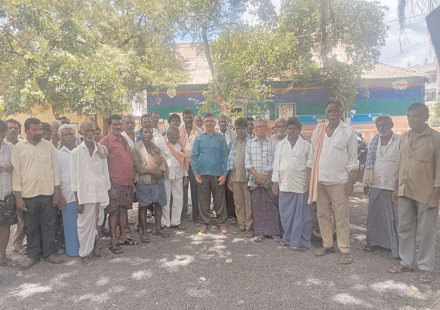
దర్శి, పెన్ పవర్ జూలై 10:

దరిశి మండలంలోని గ్రామాలలో పారిశుధ్య కార్మికులుగా (క్లామ్ మిత్ర లకు) పెండింగ్ వేతనాలు 13 నెలలు ఇవ్వాలని దరిశి ఎంపీడి ఆఫీసు వద్ద సిఐటీయు అధ్యక్షులతో నిరసన తెలిపి ఎంపీడితో, ఈ ఓ ఆర్ డిలకు అర్జీలు ఇవ్వడం జరిగింది. ఈ నిరసనకి యూనియన్ అధ్యక్ష ,