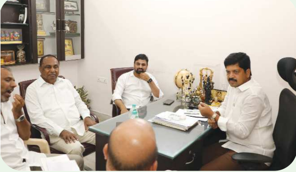
కందుకూరు పెన్ పవర్, జూలై 9