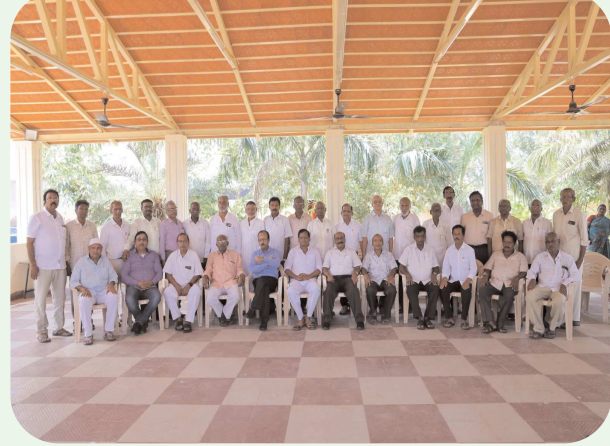
కందుకూరు పెన్ పవర్, జూలై 10