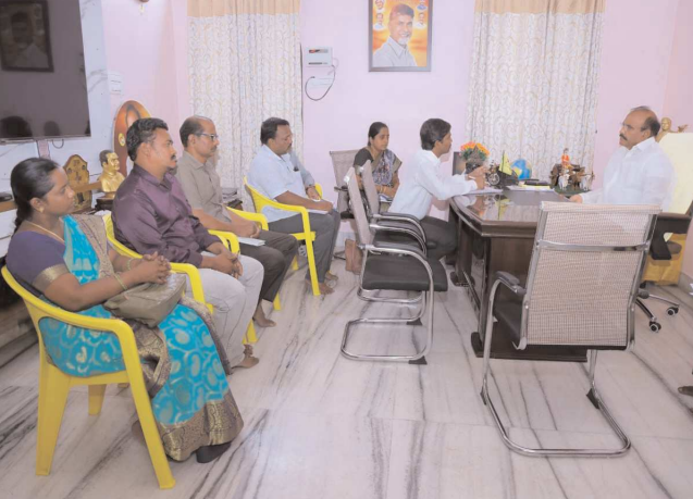
చిలకలూరిపేట పెన్ పవర్ ప్రతినిధి జూలై 10

మున్సిపల్ కమిషనర్, అధికారులతో ప్రత్తిపాటి సమీక్షా సమావేశం - మాజీమంత్రి ప్రత్తిపాటి