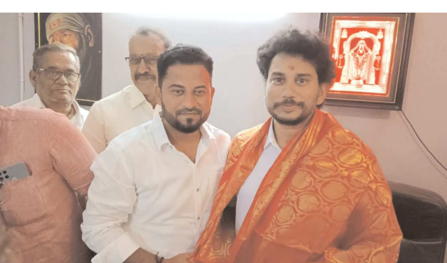
పొదిలి, పెన్ పవర్ జూలై 10

తెలుగుదేశం యువ నాయకులు మాగుంట రాఘవరెడ్డి స్పష్టం