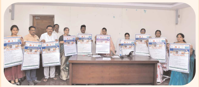
స్టాఫ్ రిపోర్టర్, పెన్ పవర్, ఒంగోలు, జూలై 10