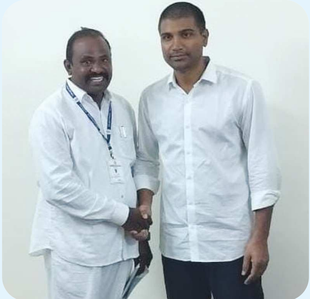
చిలకలూరిపేట పెన్ పవర్ ప్రతినిధి జూన్ 30

లావు శ్రీకృష్ణ దేవరాయలను మర్యాద పూర్వకంగా కలసిన ఏం ఆర్ పి ఎస్ నాయకులు