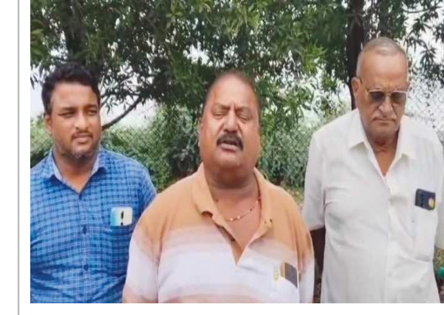
చిలకలూరిపేట పెన్ పవర్ ప్రతినిధి జూన్ 30