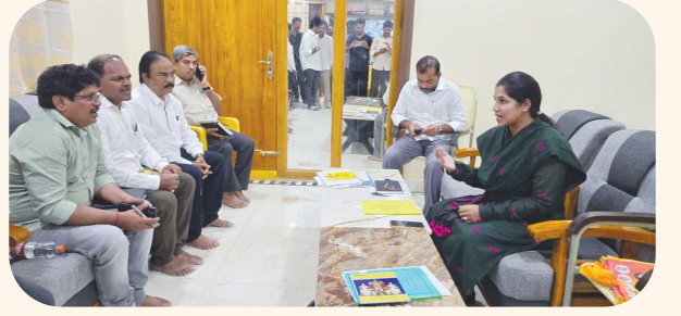
దర్శి, పెన్ పవర్ జూన్ 30

దర్శి నియోజకవర్గం లో జూలై 1 నుంచే పెంపిన పెన్షన్లు ఇంటి దగ్గర ఇచ్చే కార్యక్రమం పైన 5 మండలాల ఎంపీడిఓ తో సమావేశం ఏర్పాటు చేసి తగు చూచనలు చేశారు. జూలై 1న ఉదయం 6 గంటలకే పింఛన్ పంపిణీ ప్రారంభమయ్యింది. పింఛన్ పంపిణీలో నిర్లక్ష్యం వహిస్తే కఠిన చర్యలు. తొలిరోజే 100 శాతం పింఛన్లు పంపిణీకి ప్రణాళిక సిద్ధం చేయాలి. పింఛన్ తో ఇంటి సీఎం రేఖను లబ్ధిదారులకు ఇవ్వాలి. అర్హతైన అందరికీ నేరుగా ఇంటి వద్దకు తీసుకెళ్లి జూలై 1న ఎస్సీలలో భరోసా పింఛన్లు ?7,000 అందజేయాలని అధికారులకు ఈ సందర్భంగా డాక్టర్. గొట్టిపాటి లక్ష్మీ తెలిపారు.