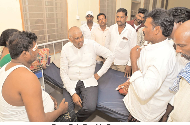
పెన్ పవర్ స్టాప్ రిపోర్టర్ బాపట్ల జూలై 3: బాపట్ల:పచ్చని పల్లెళ్లలో వివాదాలు సృష్టించాలని చూస్తే సహించేది లేదని, ఎన్నికల సమయంలోనే పార్టీల నాయకులు రాజకీయం చేయాలని