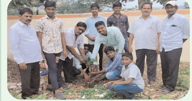
కొమరోలు పెన్ పవర్ జూలై 3